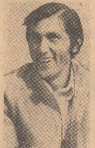
Năstase — nr. 1 european și Arthur Ashe — cel mai bun tenisman american. Pentru