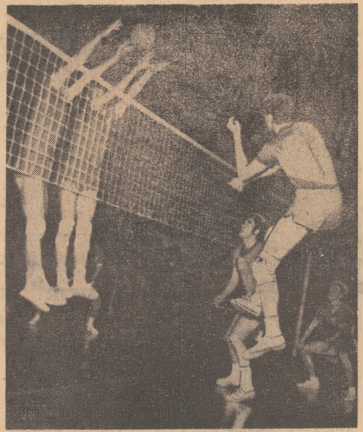
Atac dinamovist, dar care va fi respins de blocajul prompt al voleibaliștilor de la Steaua

În fața unei săli aproape pline, cum de mult nu ne-a mai fost dat să vedem la meciurile de volei, s-a desfășurat ieri după-amiază, în sala Floreasca, derbyul primel