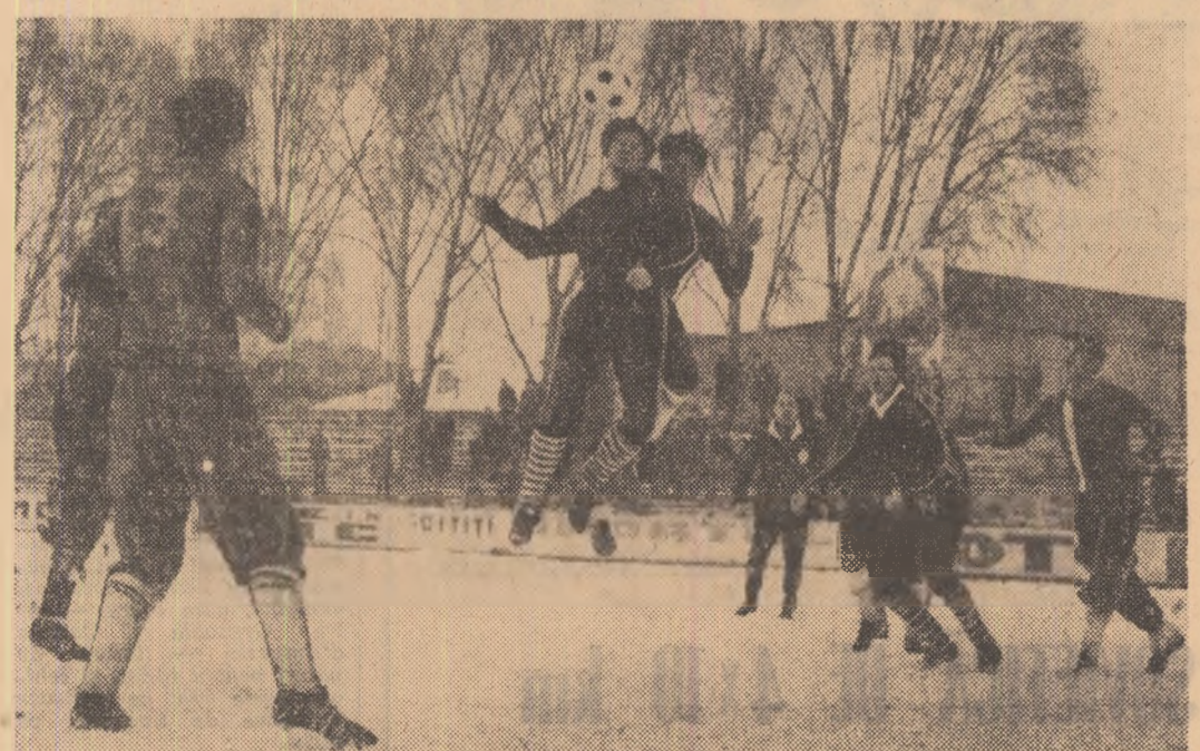
TRACTORUL în atac. Ploieşteanul Cringaşi interceptează şi respinge printr-o lovitură cu capul. Faţă din repriza secundă a meciului disputat duminică la Braşov...