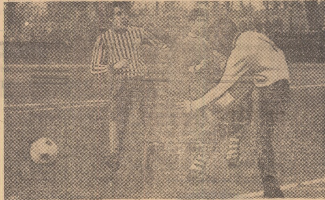
Fază din meciul disputat ieri pe Giulești