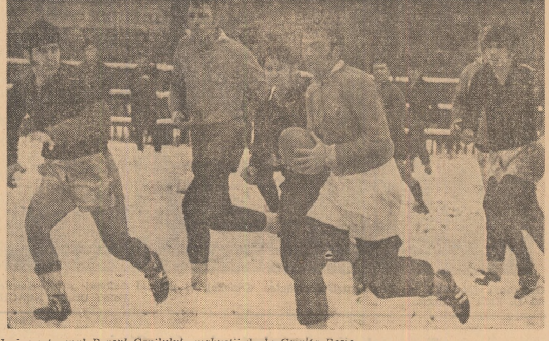
Ieri, pe terenul Parcul Copilului, rugbystii de la Grivița Roșie și Vulcan au avut de înfruntat dificultățile unui teren acoperit cu zăpadă. În imagine, rugbystii grivițeni surprinși în momentul cînd inițiau un nou atac spre burdurele adverse

CLASAMENT 1. PENICILINA 22 22 0 86: 5 44 2. Rapid 22 18 4 88:25 40 3. Dinamo 22 17 5 54:24 29 4. I.E.F.S. 22 15 7 53:33 37 5. Farul 22 13 9 49:41 35 6. Medicina 22 10 12 40:48 32 7. C.P.B. 22 9 13 38:49 31 8. U* Tim. 22 8 14 34:47 30 9. C.S.M. Sibiu 22 8 14 36:51 27 10. Cealaltul 22 5 17 31:56 27 11. U* Cluj 22 5 18 20:58 26 12. U* Craiova 22 3 19 22:43 23