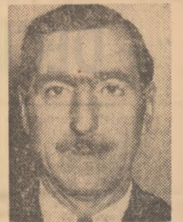
Titus OZON F. C. ARGES