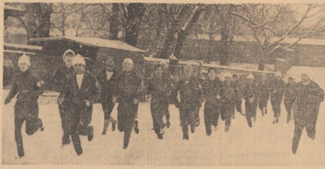
Încurajați și de victoria de la Sibiu, din Cupa României, fotbalistii de la Progresul se pregătesc cu multă grijă pentru reluarea campionatului.

Arbitrii internaționali N. Ionescu și R. Dumitru vor conduce azi, la Leipzig, prima întâlnire din cadrul semifinalei Cupei campionilor europeni la volei, dintre formațiile masculine S. C. Leipzig și Burevestnik Alma Ata.