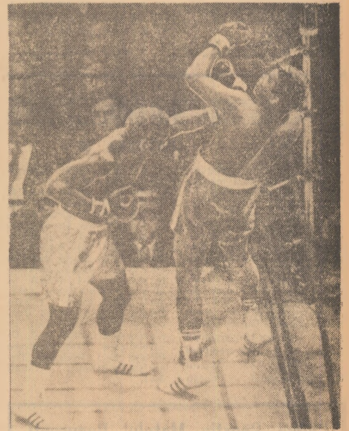
Cu această teribilă stîngă, Joe Frazier zdruncină decisiv rezis-tența adversarului său

Acum, cînd o lume întreagă a aflat rezi-tutul și după ce toți cei interesați au vă-zut la televiziune — în re-luare sau în direct — „me-ciul secolului” Frazier —