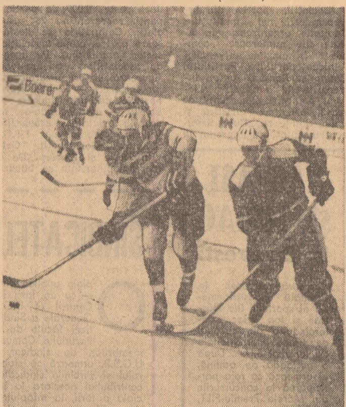
Tureanu conduce picul către poarta echipei bulgare. La capătul acestei curse fundașul nostru a înscris un gol de toată frumusețea.

Inscrierile se fac la adresa menționată, în perioada 10-20 martie a.c. între orele 10,00-18,00. Deschiderea cursurilor va avea loc la data de 25 martie 1971. Pentru relații, a se adresa la telefon 43.05.00 (C.S. Metalul), zilnic, între orele 8,00-14,00. Cursurile se desfășoară sub conducerea antrenorului Ștefan Rădulescu.