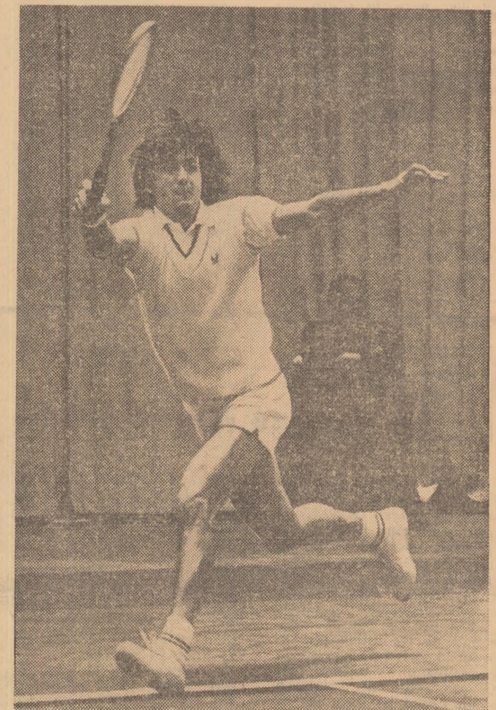
Ilie Năstase, așa cum l-au văzut spectatorii din Hampton (S.U.A.), în sala „Coliseum“.