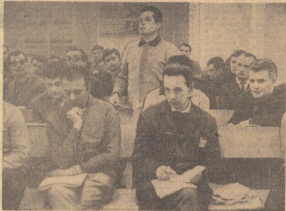
Citiți în pag. 3

O dezbatere sinceră și pasionantă a numeroaselor aspecte ale meciurilor de fotbal care privesc jucătorii, antrenorii, arbitrii, cronicarii sportivi și spectatorii