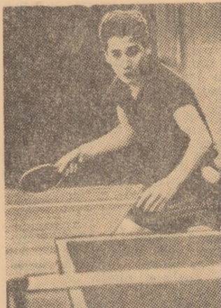
Nobuhiko Hasegawa și-a confirmat din nou înalta sa clasă, păstrîndu-și titlul de campion al Japoniei.

Dublu mixt, finala: Ohzeki, Hasegawa — Sakamoto, Itoh 2-0 (13, 18).