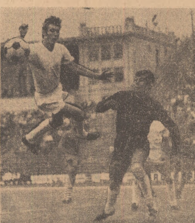
O spectaculoasă fază în partida echipei Progresul în partida cu Dinamo (scor 0-0), disputată în turul campionatului