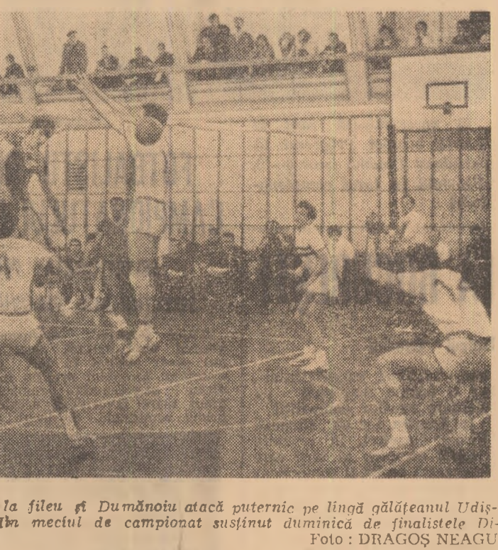
Combinatie dinamovistă rapidă la fileu și Dumănoiu atacă puternic pe linia gălățeanului Udineanu...