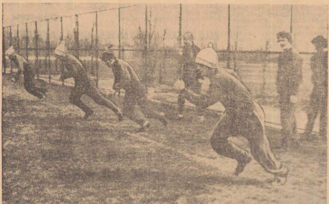
Secvență — simbolică — de la antrenamentul steliștilor, lansată de câteva etape în urmărire frunțelor. S-a dat startul într-o cursă de viteză, pe de-a latul terenului.