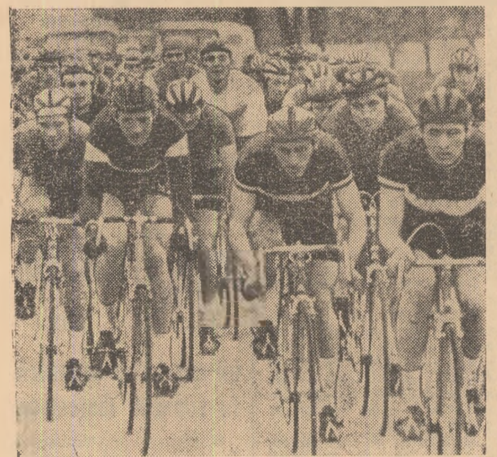
Aglomerație în pluton! Imagine realizată pe prima parte a etapei de ieri din „Cupa Steaua“