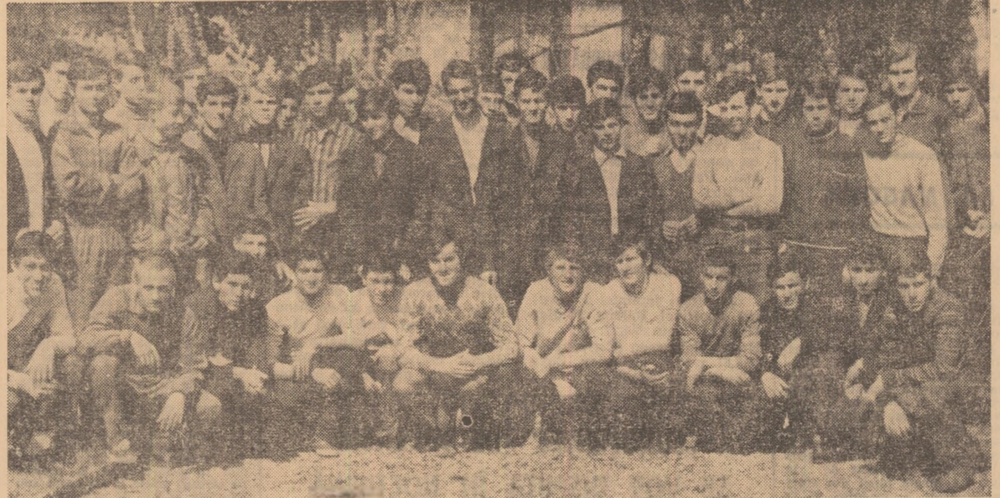
O frumoasă poză „de album” a fotoreporterului nostru Theo Marcarschi, cu ocazia unui... zmbet comun la soare.