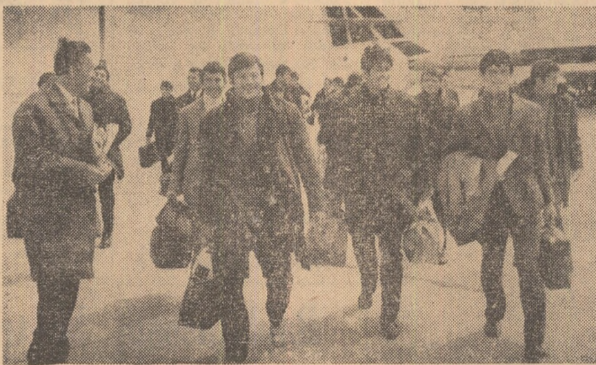
Fotbaliștii albanezi la cîteva momente după aterizarea avionului.