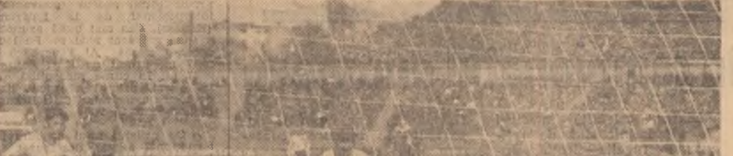
lordănescu deschide scorul pentru echipa olimpică a României

CORNEL DRĂGUȘIN - antrenor secund: "Fotbaliștii noștri au evoluat sub posibilități, ei fiind, după părerea mea, apăsați de greutatea și dențierii mai puține, pentru că nici unul din jucătorii noștri n-a atins valoarea din campionat."