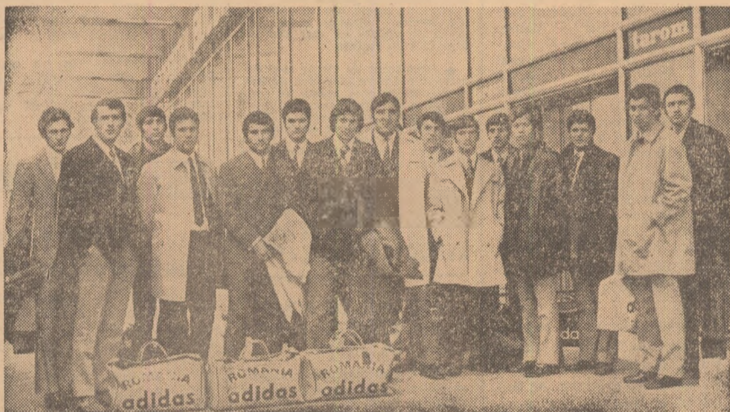
Echipierii naționalei noastre înainte de urcarea în avion, pe aeroportul Otopeni

Interes deosebit pentru meciul amical Iugoslavia — România, de mine