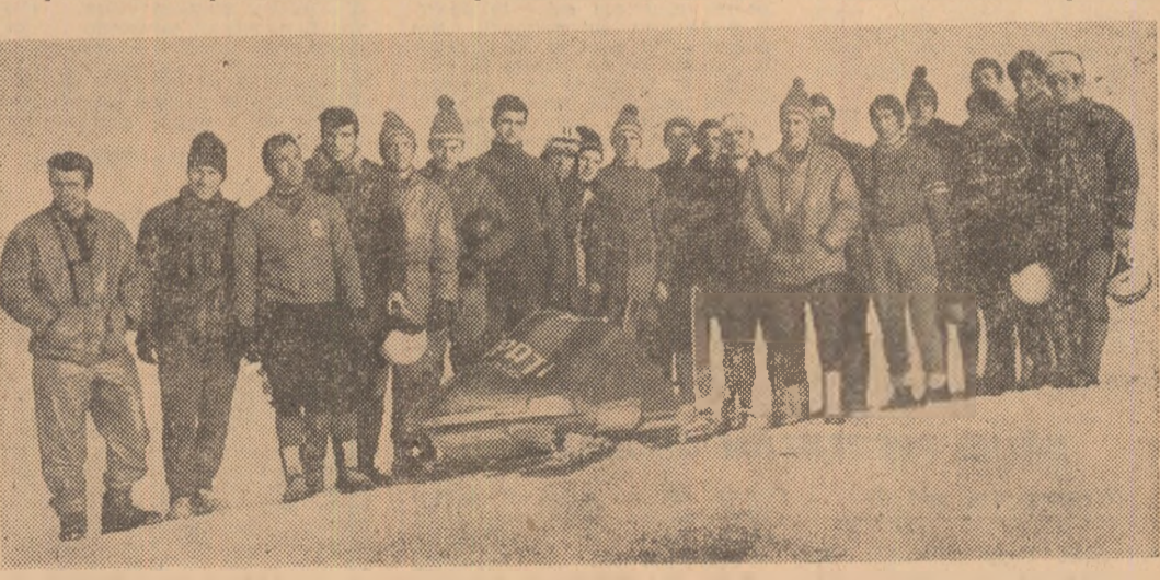
La 2000 m altitudine, la Piatra Arsă, bobierii au făcut în primele zile ale lui aprilie ultimele coboriri pe gheață din acest sezon. Ele au marcat începutul pregătirilor pentru Sapporo. Alături de cele două echipe olimpice, în imagine sînt prezente și „speranțele” bobului

ION ZANGOR: Sapporo are o pitie tehnică. Nu prea ra-