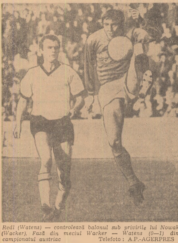
Redl (Watens) — controlează balonul sub privirile lui Nowak (Wacker). Față din meciul Wacker — Watens (0-1) din campionatul austriac.

Miercuri, 21 aprilie CAMPIONATUL EUROPEAN Gr. I: Tara Gallior — Cehoslovacia Gr. III: Elveția — Malta Anglia — Grecia Gr. IV: Irlanda de Nord — Cipru Gr. V: Portugalia — Scotia PRELIMINARIILE OLIMPICE Irlanda — Iugoslavia Elveția — Danemarca MECI AMICAL Iugoslavia — România Sîmbătă, 24 aprilie CAMPIONATUL EUROPEAN Gr. VII: R.D. Germană — Luxemburg Gr. II: Ungaria — Franța Duminică, 25 aprilie CAMPIONATUL EUROPEAN Gr. VIII: Turcia — R.F. a Germaniei