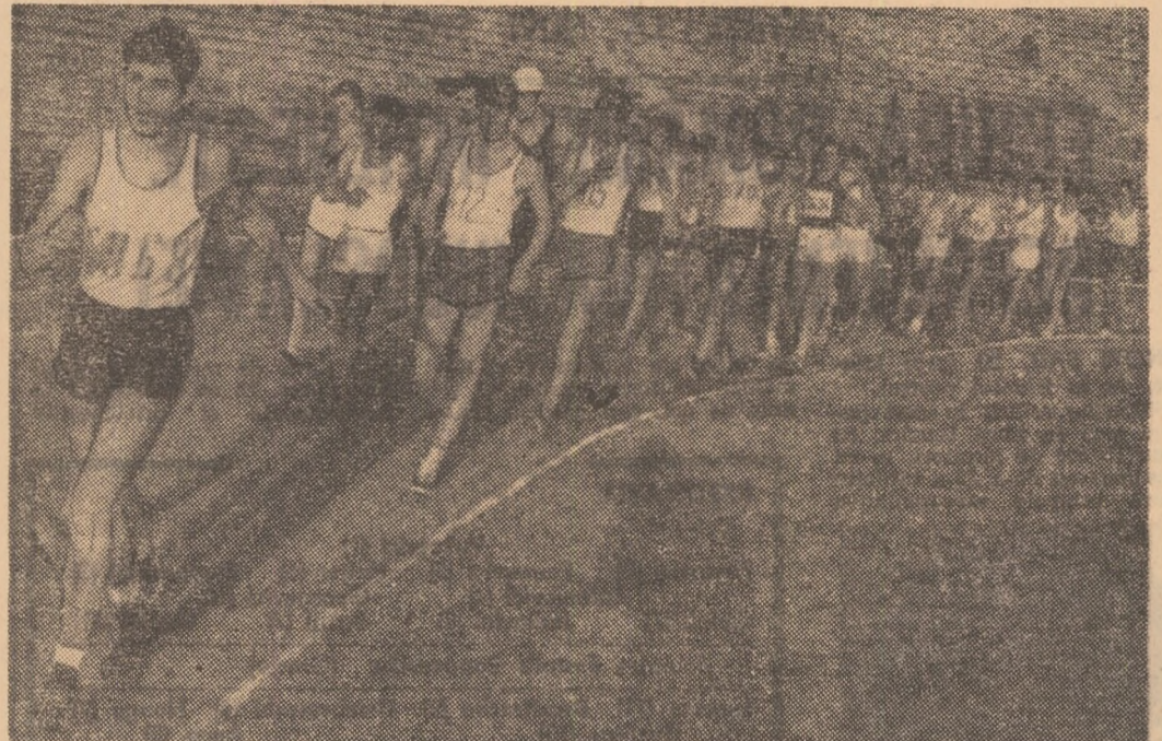
Start bogat in proba de 5 km mara a juniorilor II