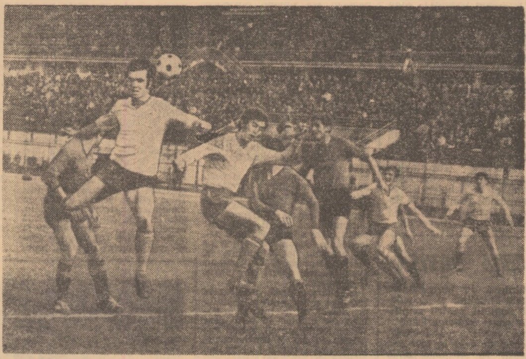
Jucătorii înghesuși pe un spațiu de câțiva metri pătrați, la marginea careului albanez!