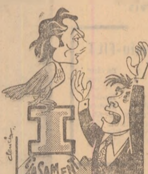
— „Bătrînul” DAN trăiește ca șoimul... SINGURATIC...