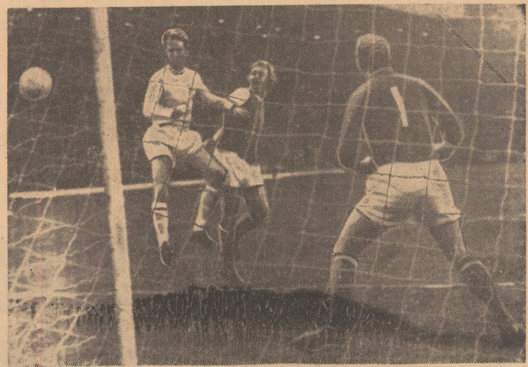
Ultimul minut de joc și... Jackie Charlton înscrie, cu capul, golul victorios al echipei Leeds, în partida de final seara cu Arsenal!

Biroul Ligii europene de naționale a studiat o propunere a Federației internaționale privind organizarea primelor campionate mondiale. Pentru găzduirea acestor campionate s-a oferit Iugoslavia, competiția urmînd să aibă loc în anul 1974. Într-un alt an, respectiv sînt programate campionatele europene de la Viena, Liga va examina ulterior posibilitatea de a organiza campionatele mondiale fie în anul 1973, fie în anul 1975.