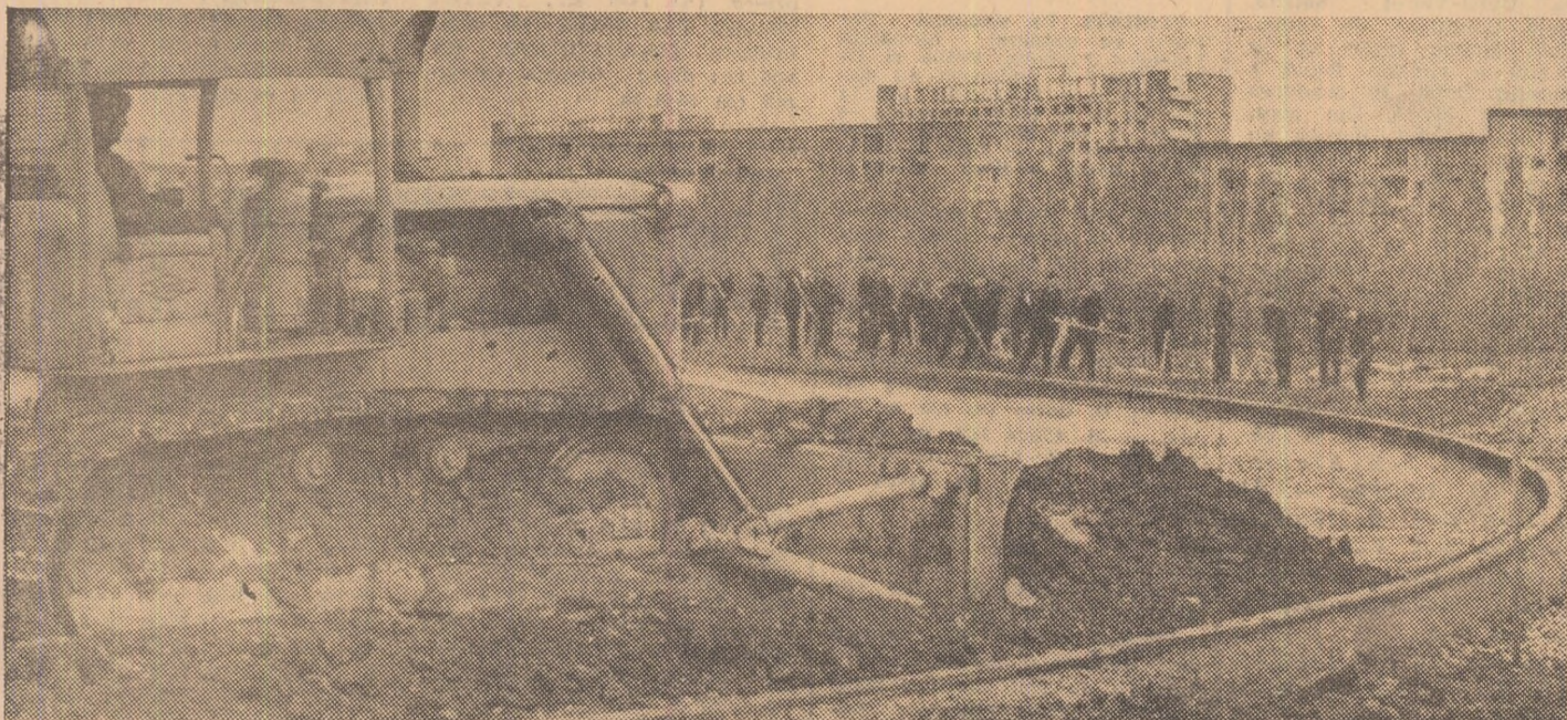
Se lucrează de zor la complexul polisportiv din Reșița.