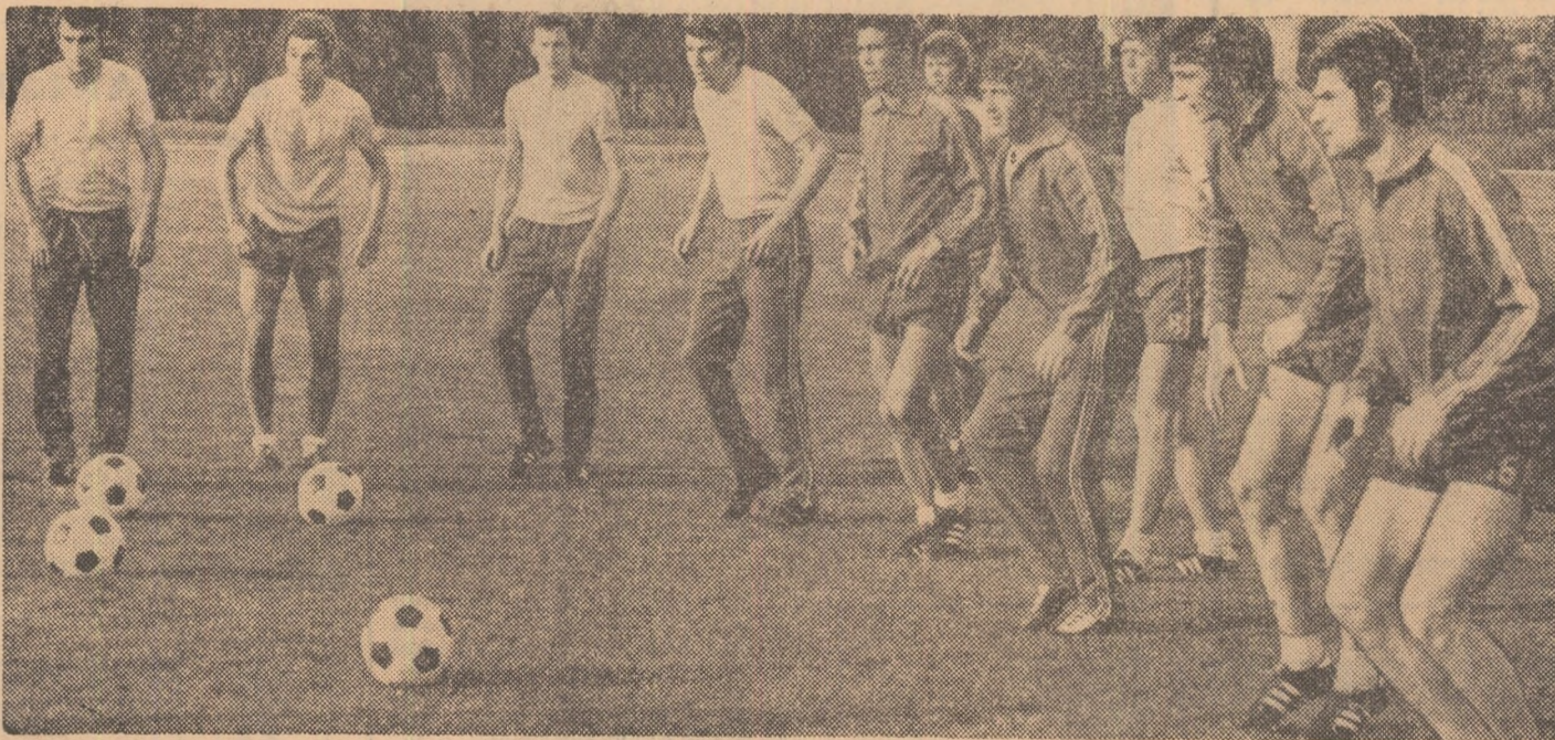
Iată un moment surprins în prima parte a antrenamentului ce a avut loc ieri după-amiază la Snagov. Tricolorii execută ușoare exerciții de încălzire

Trecuseră 24 de ore de când selecționabilii se întinseseră la sediul federației. Luni, unii dintre ei erau, evident, marcați de meciurile din ziua precedentă, de victoria sau de înfrângerea echipei lor de club.