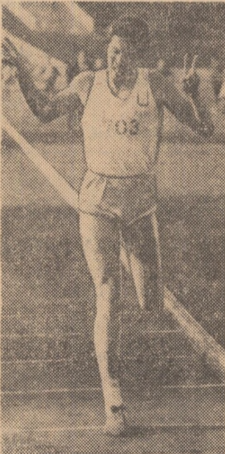
Celui, trecînd linia de sosire în cursa de 1500 m, arătînd cu degetele semnul V, al victoriei.

Între timp, în fotografia realizată de colaboratorul nostru Călin