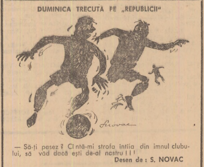
— Să-ți pasesi? Cîntă-mi strofa întâia din imnul clubului, să văd dacă ești de-al nostru!!!

— Vreți să fiu sincer? Aș vrea să devin arbitru nr. 1 al țării și un nume în rîndul cavalerilor fluturului cu ecuson F.I.F.A. Un vis îndrăzneț, nu? Nu am încă ecusonul și mă gîndesc să conduc în-tîlniri cu miză în competițiile