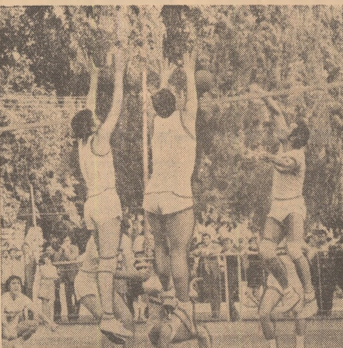
În interesantele partide ale turneului masculin, victoria a fost obținută de studenții de la I.E.F.S. Fotoreporterul nostru Dragoș NEAGU a surprins această frumoasă imagine în timpul disputelor preliminare

sportive bucureștene rezervate finalilor, precum și buna pregătire generală a participanților, unii dintre ei evoluînd aproape de o cotă foarte exigentă a performanței. Nu ne propunem, însă, o radiografie izolată a acestor finale, considerînd, firesc, că ele au făcut parte integrantă din complexa întrecere sportivă studentescă, care își propunea, la ediția din acest an, să demonstreze cit se poate de convingător nu doar progrese realizate într-o disciplină sau alta, ci o dezvoltare multilaterală, la nivelul tradițiilor, al condițiilor, și al cerințelor potrivit cărora sportul universitar trebuie să devină o puternică verigă a mișcării de educație fizică și sport din țara noastră.