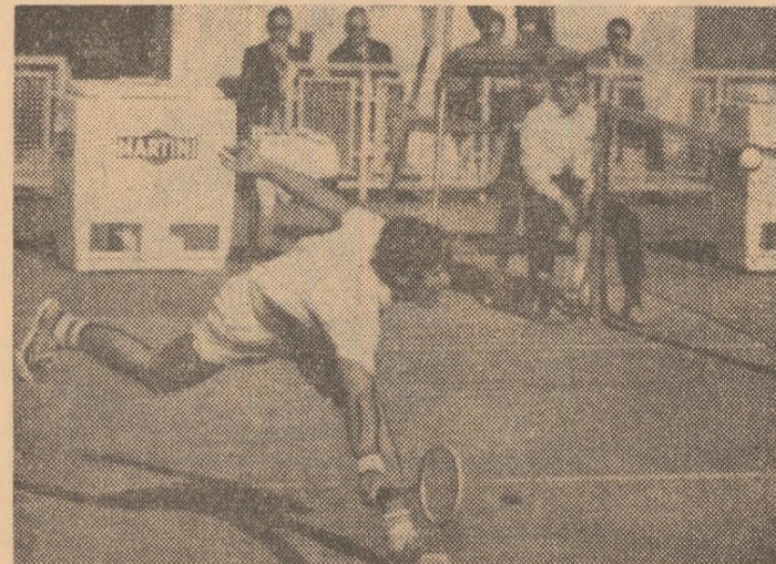
Un meci de tenis din cadrul turneului de la Hamburg.