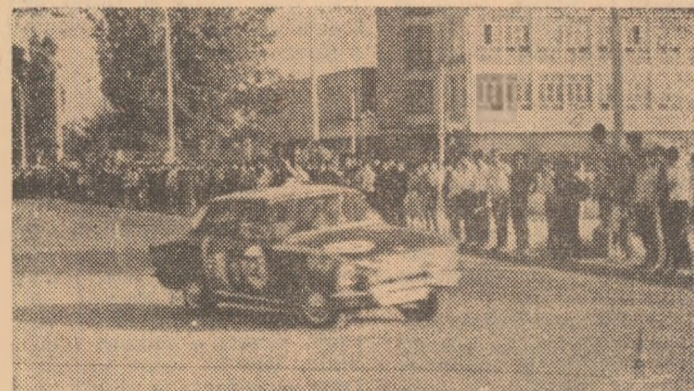
La Craiova, numeroși spectatori au urmărit cu interes cum s-au strecurat mașinile concurenților printre jaloarele stalomului