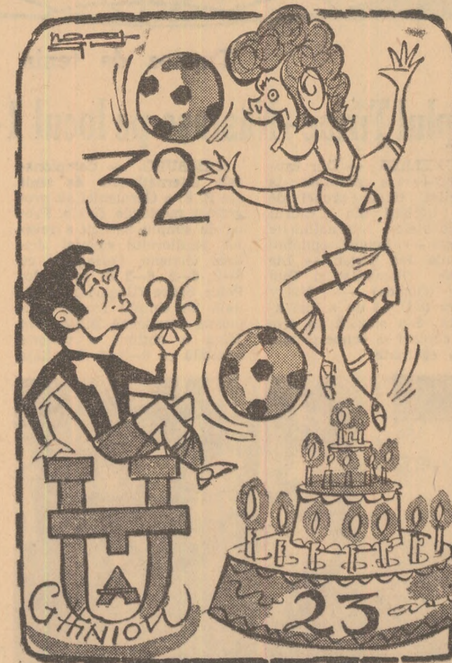
Broșovschi: Unele cu ghinion și altele fără...