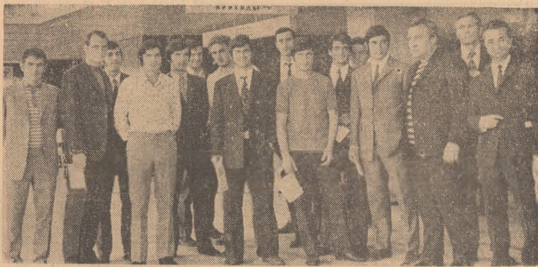
„Olimpicii” — surprinși de fotoreporterul nostru Dragoș Neagu — pe Aeroportul Internațional Otopeni, înaintea plecării spre Tirana.