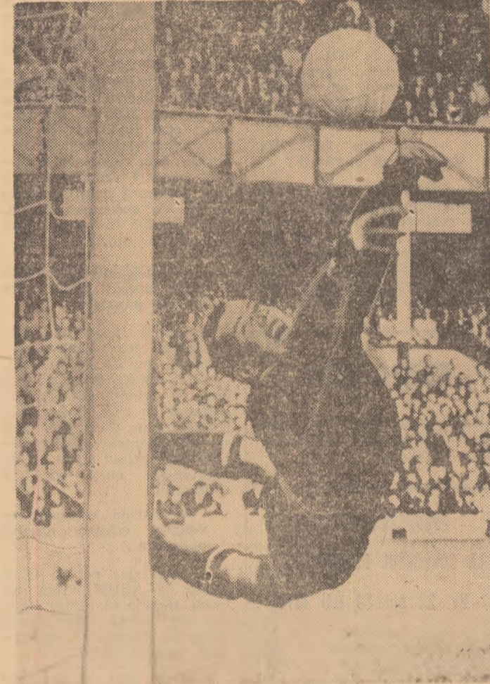
Acesta a fost „Leul” Iașin...

lucită cariera dv. de la primele apariții? — Nu, începutul a fost foarte greu. Am avut destule dezamăgiri. Nimoni nu întrezărea în mine un portar de valoare. După primele două partide susținute la Dinamo Moscova, prin anul 1950, am fost cotat ca insuficient pregătit. Pentru doi ani, am trecut în rindul rezervelor. Am nunciat mult să revin. Ca să a-pori o minge la un meci, trebuie să respingi o sută la antrenament.