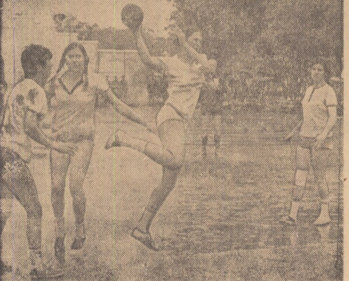
Să sperăm că miine, cînd va avea loc derbyul „U“ București - I.E.F.S. handbaliste noastre frunțase vor avea condiții mai bune de întrecere!

Dintre jocurile care atrag în mod deosebit atenția ne vom opri, în mod special, la cele ale căror rezultate influențează lupta pentru ocuparea primelor locuri.