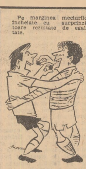
Pe marginea meciurilor încheiate cu surprinzătoare rezultate de egalitate.

arbitrajului necorespunzător nu poate explica și ierta țesăturile talentatului, dar belicosului