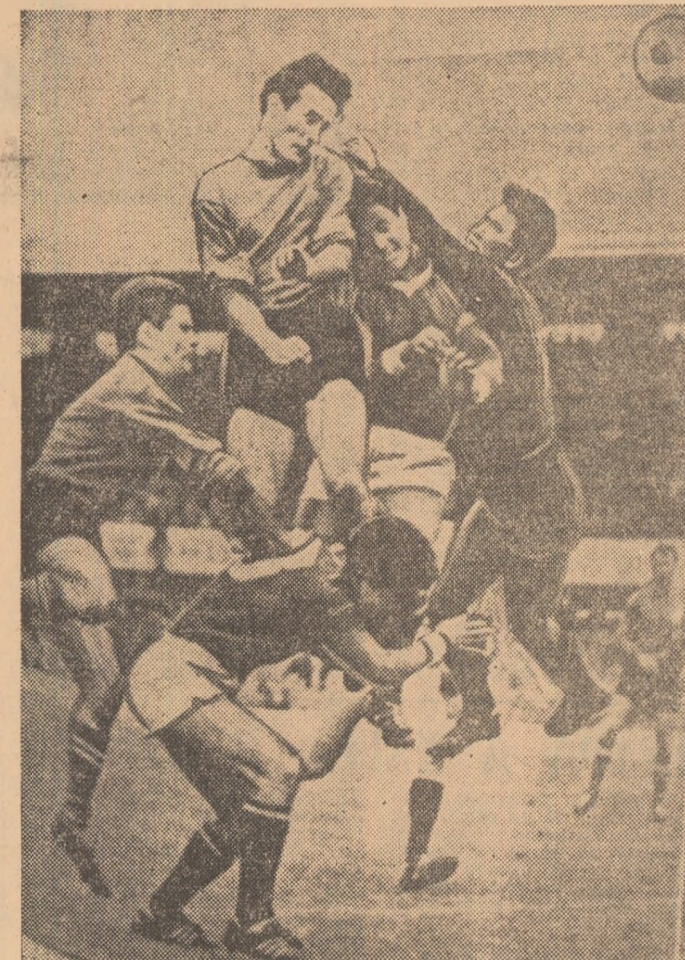
O spectaculoasă fază dintr-un meci memorabil, R.P.D. Coreeană — Italia 1—0, partidă de la C.M. din Anglia

Din numeroasele și puternicele impresii păstrate de la Phenian, un capitol aparte îl reprezintă, de bună seamă, viața sportivă întîlnită în capitala R. P. D. Coreene. Știam că tenisul de masă și voleiul feminin au ajuns la culmi de virtuozitate, cunoașteam pe de rost senzaționala evoluție a fotbalistilor la Campionatul mondial