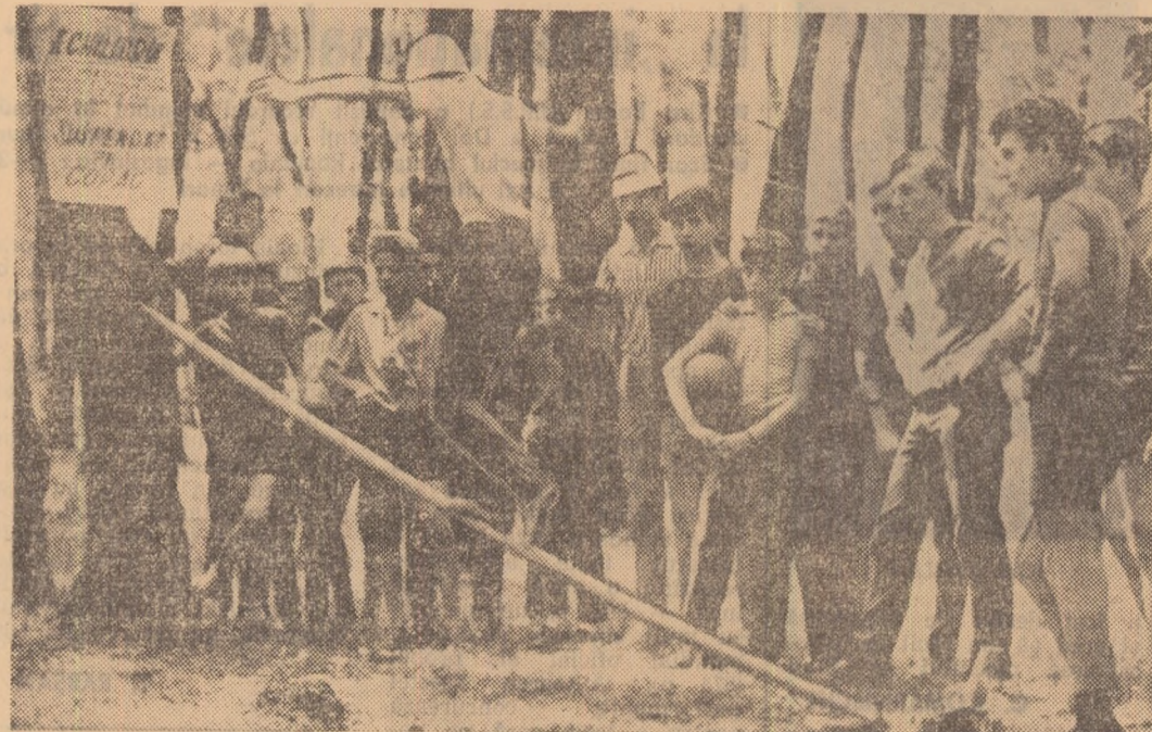
In echilibru pe o prăjină lunecoasă - iată o probă care cere multă îndemnare.