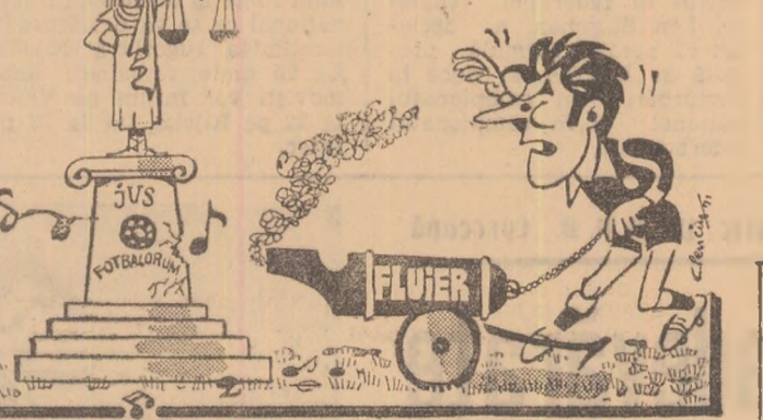
Desen de Al. CLENCIU