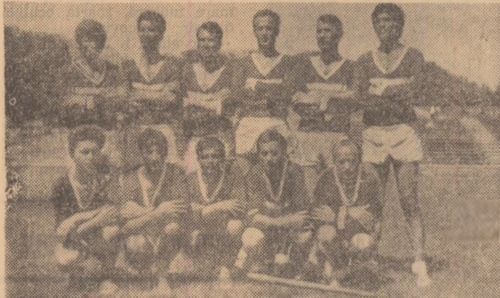
Echipa C.P.B. la citeva minute după cistigarea „Cupei României”, ediția 1971

Finala „Cupei României”, s-a desfășurat într-o nouă formă. In prima fază, cele opt echipe, care și-au cucerit dreptul de a participa la acest final al competiției și-au disputat inițiativa într-un sistem eliminatorki, formația aflată la două înfrîngeri, urmînd a părăsi întrecerea. Preliminariile au dat loc la o luptă palpitantă. Calificările și recalificările au trecut echipele printr-o sită deasă, iar in turneul final au ajuns C.P. București, Biruința Gherăști (Jud. Neamț), Celuloza Călărași și Viața Nouă Olteni (Jud. Teleorman), care au manifestat o evidentă superioritate față de celelalte formații. Turneul final avea să confirme așteptările, cele patru candidate la primul loc oferind paritate viu disputate, presărate cu faze spectaculoase și încheiate cu victoria meritată a echipei C.P.B., care a cistigat toate meciurile și a cucerit astfel trofeul pus in joc. Turneul pentru locurile 5-8 a fost dominat de Avîntul Prahin, care a avut in echipele A-