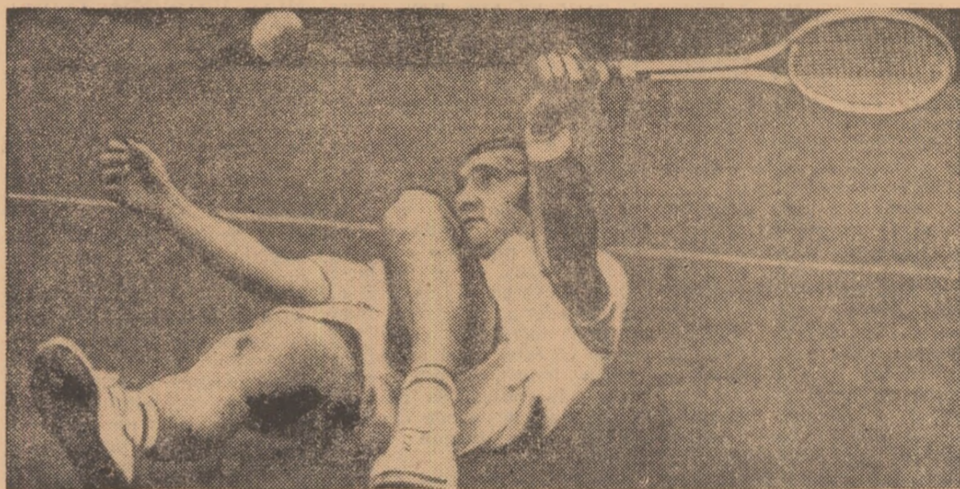
Australianul Tony Roche a căzut — la propriu și la figurat — în primul tur al competiției de la Wimbledon, fiind învins de portoricianul Charles Passarell în patru seturi.