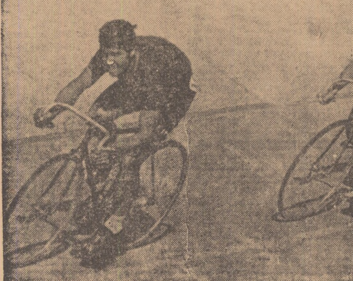
Aspect din interesantele curse de viteză ale juniorilor, desfășurate ieri.

Campionatele continuă astăzi, începînd de la ora 16,30.