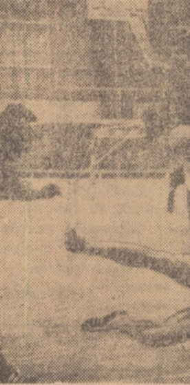
Confrîntîndu-și valoarea, handbaliștii români au obținut titlul de campioni mondiali la Paris. Ei au datorat să lupte pentru a învinge și la J.O. de la München. În fotografia noastră o fază din meciul România — Franța disputat în cadrul C.M.

● Numeroase și dificile teste au triat valorile ● Nume noi în echipa națională ● Recuperarea — o problemă deficitară ● Performanțele de pină acum se cer confirmate