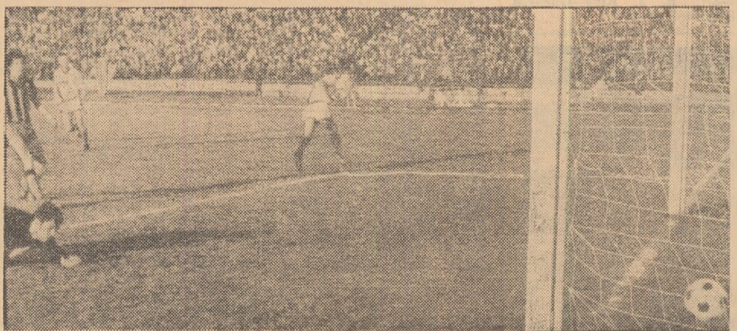
...A marcat Oblemenco. Este minutul 50 al partidei de la Craiova, cu Progresul, și echipa bucreșteană este virtual retrogradată. Dar „bancații“ vor reveni puternic și vor termina meciul la egalitate, amîndîna trista „prominare“ — pentru ei sau pentru... C.F.R. Cluj — pentru ultima etapă

Centrul de copii și juniori al clubului Rapid București organizează o selecție pentru copiii născuți în anul 1955-1961. Meciurile se pot prezenta la stadionul Giulești începînd de azi pînă în ziua de 10 iulie, de la ora 9. Copiii vor avea pantofi de tenis și chiloți.