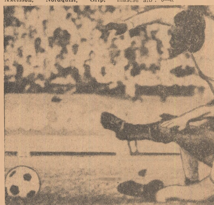
În turneul desfășurat în orașul canadian Toronto, F.C. Santos a dispus cu 2—1 de Bologna. Iată-l pe Pelé (în tricou alb) în luptă cu un fundaș al echipei italiene.