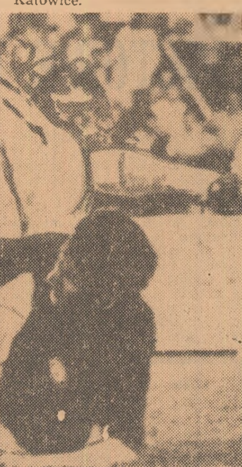
În turneul desfășurat în orașul canadian Toronto, F.C. Santos a dispus cu 2—1 de Bologna. Iată-l pe Pelé (în tricou alb) în luptă cu un fundaș al echipei italiene.

Campionatul Poloniei a fost câștigat de echipa Gornik Zabrze, care a totalizat 39 p. din 52 posibile. Pe locurile următoare s-au clasat formațiile Legia Varșovia — 34 p., Zaglembe Waibich — 27 p., Pogon — 27 p. etc. Au retrogradat în divizia secundă echipele Rov Rybnik și G.K.S. Katowice.