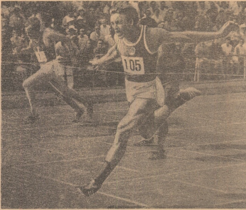
Finisul impetuos al lui Valeri Borzov surprins de un fotoreporter la finala Cupei Europene — 1970.

Deși creditat cu un rezultat foarte bun (10,2) încă în anul Olimpiadei mexicane — an în care Borzov câștiga trei titluri la Jocurile europene pentru Juniori de la Leipzig — numele lui Valeri — al doilea mare Valeri al atletismului sovietic — nu spunea nimic amatorului de atletism prins în vîrtul avalanșelor de recorduri mondiale stabilite în anul olimpic. În sezonul următor însă, sezon de „răgaz post-olimpic”, Valeri își umeste pe toți specialiștii, egalind în cadrul campionatelor Uniunii Sovietice, la Kiev, recordul european vechi de aproape un deceniu al vest-germanului Armin Hary, performanță realizată în 1958 și de francezul Roger Bambuck ca și de compatriotul lui Borzov, Vladimir Sapeja. Neîncrederea cu care a fost primită la început realizarea lui Borzov i-au luat locul, în toamna aceluiași an, superlativul care salută victoria sa la campionatul European desfășurat la Atena. De atunci, lui Borzov, care era de fapt cel mai bun sprinter al continentului, îi este recunoscută drept această calitate, deosebită aici unul din alergătorii de viteză europeni nu se poate lăuda cu o victorie asupra campionului sovietic, pe distanța sa preferată, 100 m.