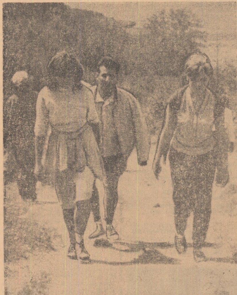
Pitoreștile împrejurimi ale stațiunilor, un punct de atracție pentru oamănii sosiți la odihnă. În ultima vreme însă cei ce ar trebui să se îngrijească de mișcarea dramatică le-au dat uitării. Imaginea de foteoteacă pe care o alăturăm ar putea să le reamintească de ele

F ără îndoială, necesitatea integrării sportului între activitățile rezervate oamenilor ce-și petrec concediul în stațiuni nu mai trebuie argumentată. Sportul este un adjuvant însemnat în fortificarea sănătății, dar și un factor rector al numeroase valențe, utilă atât celor ce vin în stațiuni în căutarea tămăduirii unor afecțiuni cât și celor sosiți la odihnă. Dar trebuie să subliniem faptul că în stațiunile de pe Valea Oltului, vizitate de noi, nu există suficientă preocupare pentru activitatea sportivă. Dacă pe tărâm cultural se fac unele efor-