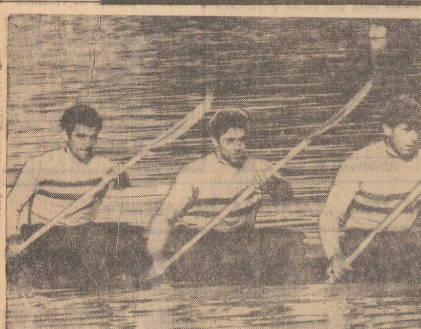
Echipajul de K 4, învingător în finala probei olimpice.