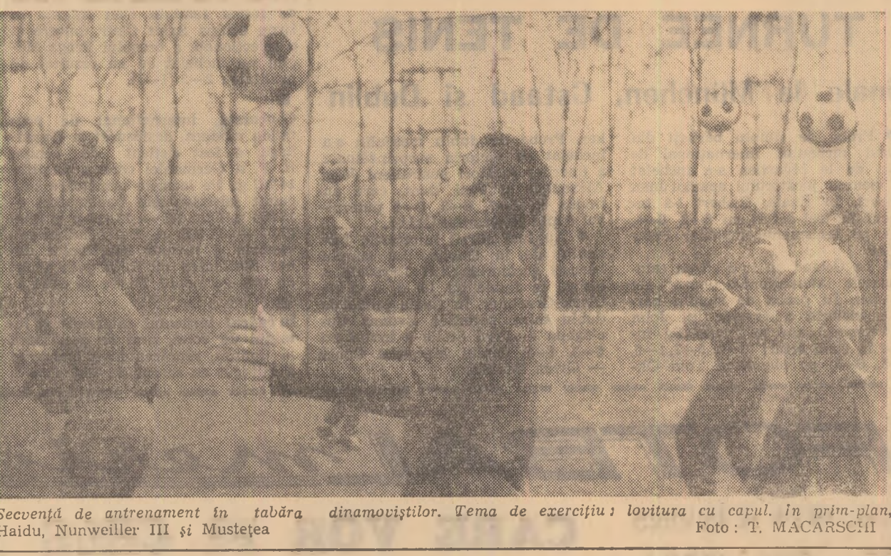
Secență de antrenament în tabăra dinamoviștilor. Tema de exercițiu: lovitura cu capul...