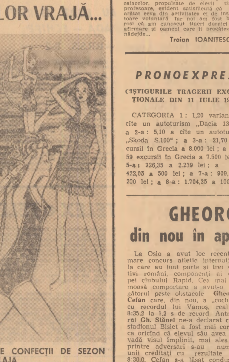
IMBRACAȚI-VA CU ELEGANTE CONFEȚII DE SEZON ȘI DE PLAJĂ