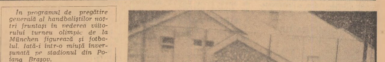
În programul de pregătire generală al handbaliștilor noștri fruntași în vederea viitorului turneu olimpic de la München figurează și fotbalul. Iată-i într-o mișcă înverșunată pe stadionul din Poiana Brașov.

FLORIN GHEORGHIU mare maestru internațional de șah