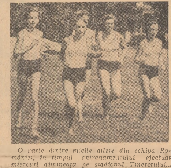
O parte dintre micile atlete din echipa Romaniei, in timpul antrenamentului efectuat miercuri dimineata pe stadionul Tineretului...