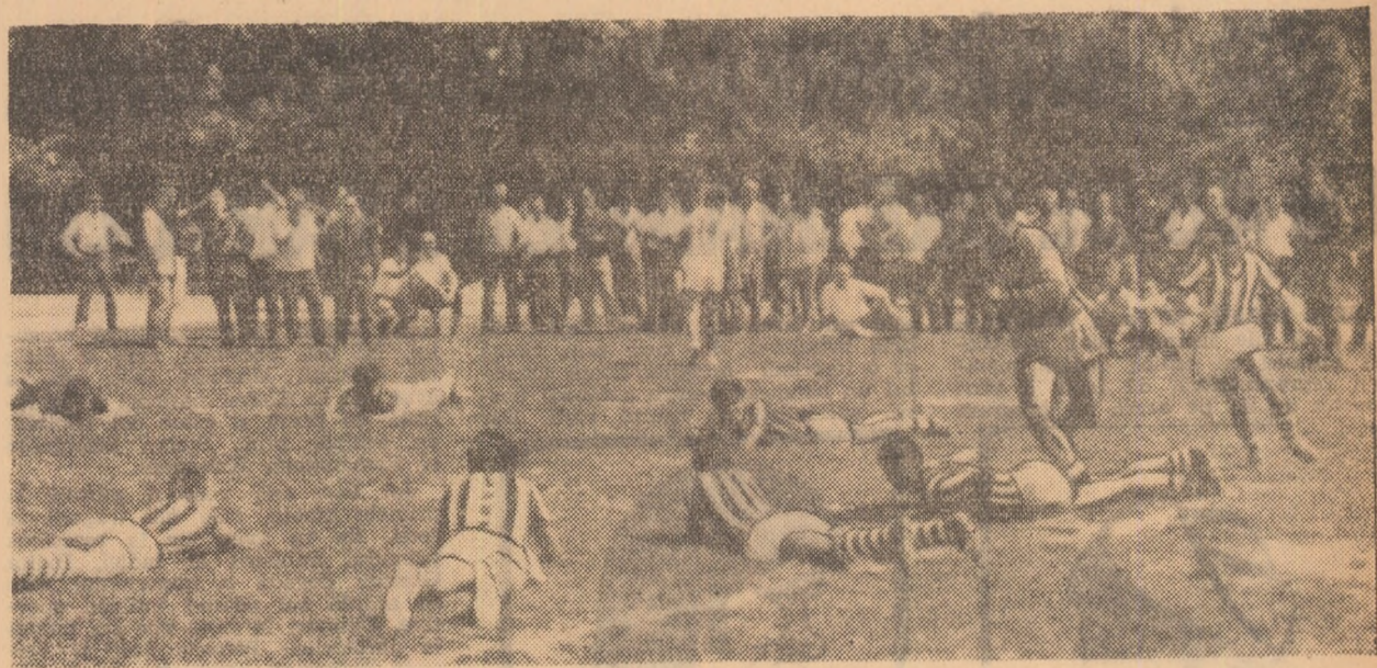
Demonstrație practică. Exercițiu pentru dezvoltarea spiritului de observație, a atenției.