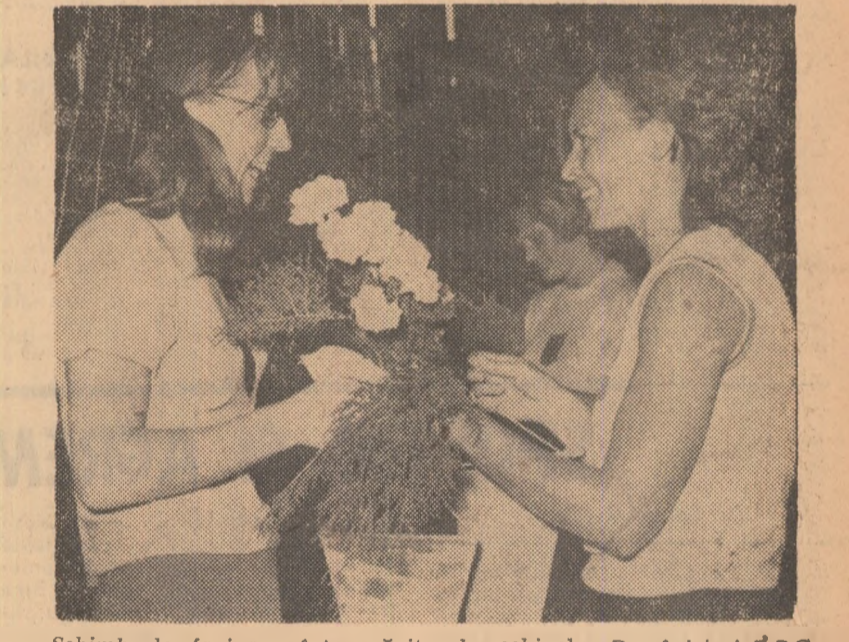
Schimb de fanioane între căpitanele echipelor României și R.F.G. (în stînga) Turneul internațional de volei feminin de la Constanța