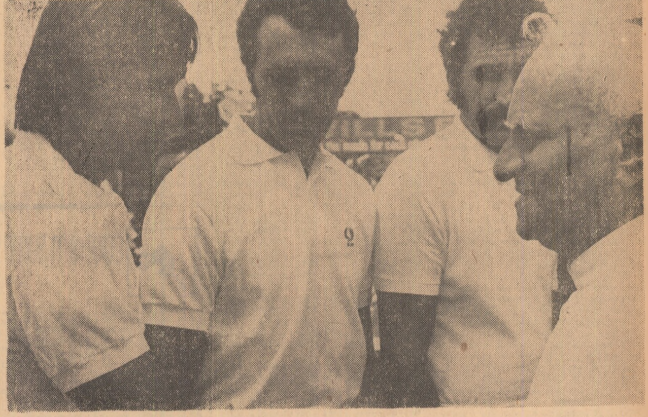
O amintire de preț în albumul al echipei de tenis a României: președintele Indiei, S. Venkata Giri, dînd mina cu jucătorii noștri, pe terenul întrecerii — Ilie Năstase, Petre Mărmureanu și Ion Țiriac.

Năstase și Țiriac vor trece acum Oceanul, pentru a juca împotriva brazilienilor. Se anunță din nou un meci di-