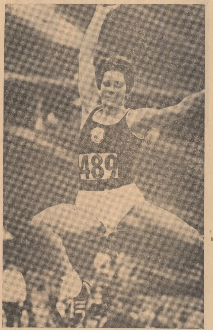
Heide Rosendahl, recordmana mondială la săritura în lungime (6,84 m)

În cadrul meciului triplușaltar Cehoslovacia-Ungaria-Polonia ce se