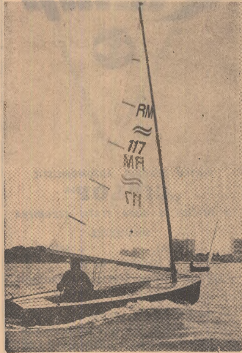
Yachtingul la el acasă, pe Stutghiol

Ce-am constatat acum, la ora de vîrf a sezonului estival?