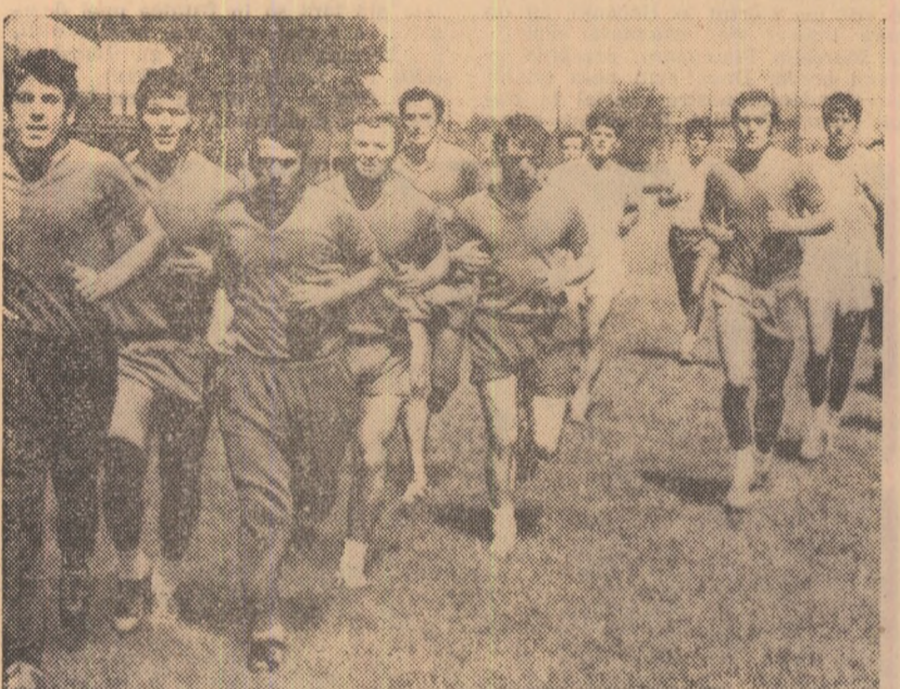
Jucătorii Rapidului la antrenamentul efectuat ieri dimineață în Giulești.

puțin aceste frământări. Am auzit și eu de ele și chiar le-am simțit în unele jocuri ale Rapidului din returul campionatului trecut. Mi-am dat, deci, seama că nu va fi ușor pentru mine, dar am rămas la credința că o activitate este