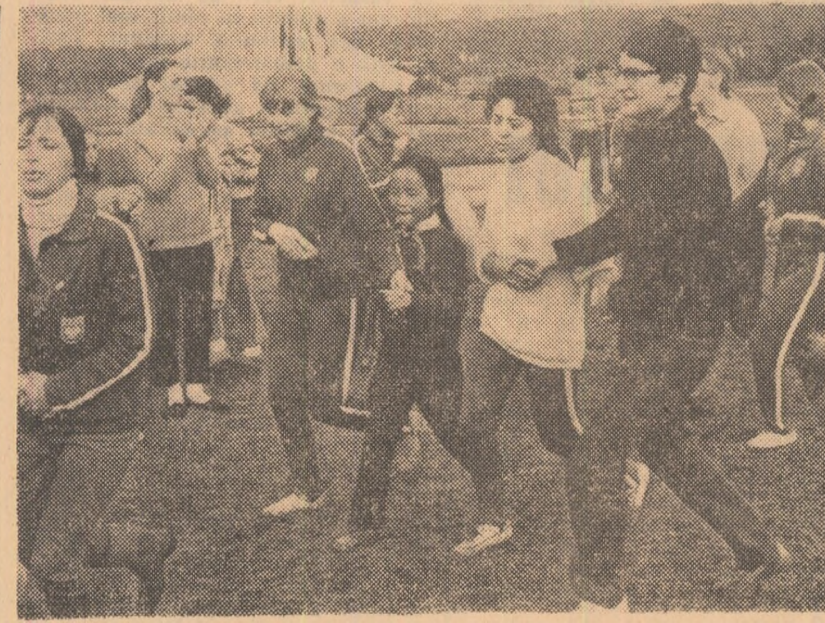
In tabără se leagă cele mai frumoase prietenii. Citeva sute de copii din Danemarca, Franța, Iugoslavia, R. P. Mongolă și R. D. Vietnam au participat în această vară la tradiționala tabără de vară de la Chorow (Polonia), unde au petrecut zile minunate

un element decisiv, poate, pentru întreaga desfășurare a întrecerilor. Finala interzone Brazilia - România prezintă aspecte cât se poate de limpeză. Rămâne în vigoare tragera la sorti inițială, deoarece cele două echipe nu s-au intilnit, pînă acum, niciodată. SE VA JUCA, DECI, LA SAO PAULO, așa cum au decis gazdele penultimei intilniri din marea competiție. Ultima va fi - reamintim - finala cu echipa S.U.A., detinatoarea trofeului, faimosul Challenge-round. Mai rămîn de stabilit datele meciului. Regulamentul prevede ca termen-limită pentru finala interzone ziua de luni, 16 august. Este logic deci ca finala Brazilia - România să se dispute în zilele de 13, 14 și 15 august. Cum însă tenismenii noștri au fost reținuți cu două zile mai mult, la New Delhi, pentru semifinalea cu India, ei ar avea dreptul să ceară un termen suplimentar pentru acclimatizare. Mai ales că, în actuala conjunctură, echipa României parcurge o diferență de fus orar - între New Delhi și Sao Paulo de 7 ore, Râmne, deci, să așteptăm ultimele hotărâri în această problemă. Un lucru rămîne cert: jucăm la Sao Paulo!