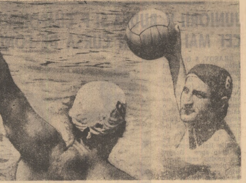
De abia sosiți de la Varna, ei s-au antrenat ieri la Dinamo și azi pleacă la Budapesta.