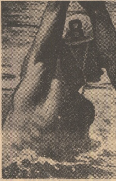
Poloștii din reprezentativă nu au nici un moment de răgaz. De abia sosiți de la Varna, ei s-au antrenat ieri la Dinamo și azi pleacă la Budapesta.