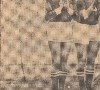
Meciurile campionatului mondial feminin de fotbal, care încep azi în Mexic, vor furniza desigur fotoreporterilor și subiecte ca acesta, ilustrat mai sus. Motto: „Implorează...”

curge la executarea unor serii de 5 lovituri de la 11 m, bineînțeles dacă egalitatea se menține și după prelungiri.