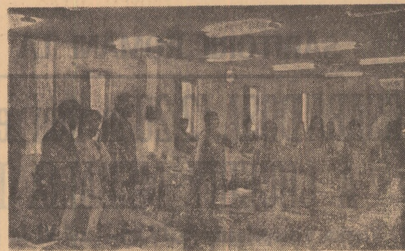
În ritmul unei melodii vioace, salariații de la Daini Seikosha (secția computere) încep suta cîntărilor de exerciții fizice

● Exercițiul fizic determină „ora exactă” ● Un singur sort de pudră și o cameră de purificare ● SEIKO și SONNY se perfecționează prin sport și muzică