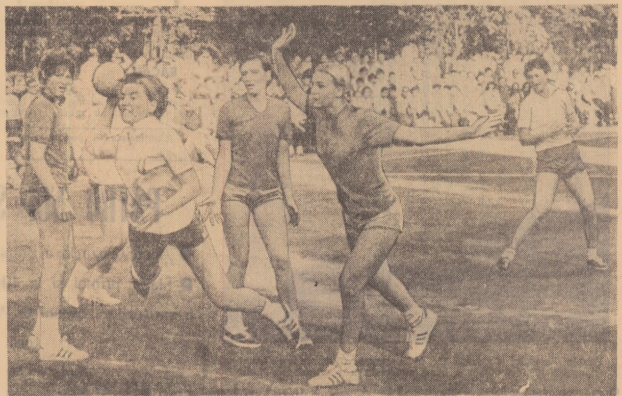
Fostele și actualele campioane („U” Timișoara și „U” București) într-una din dispulele lor din campionatul trecut.