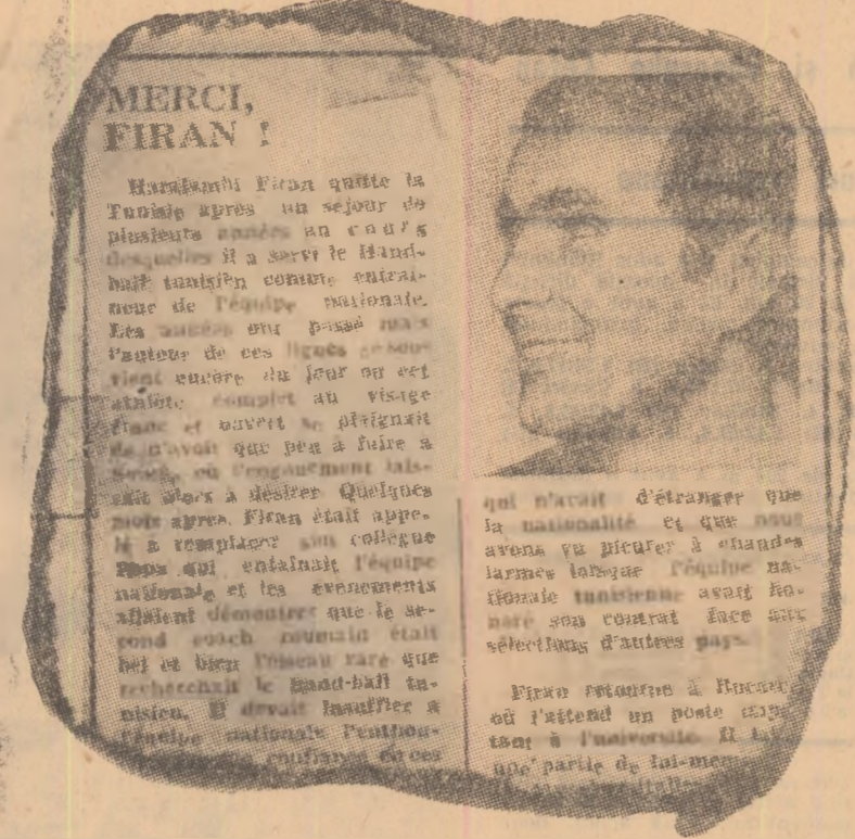
Merçi Firan! — titlul unui articol apărut în presa din Tunisia...