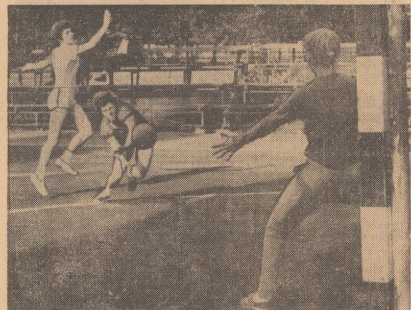
Ieri s-au desfășurat meciurile etapei a IV-a al campionatului feminin de handbal. Iată o fază din partida Confecția — Textila Buhuși