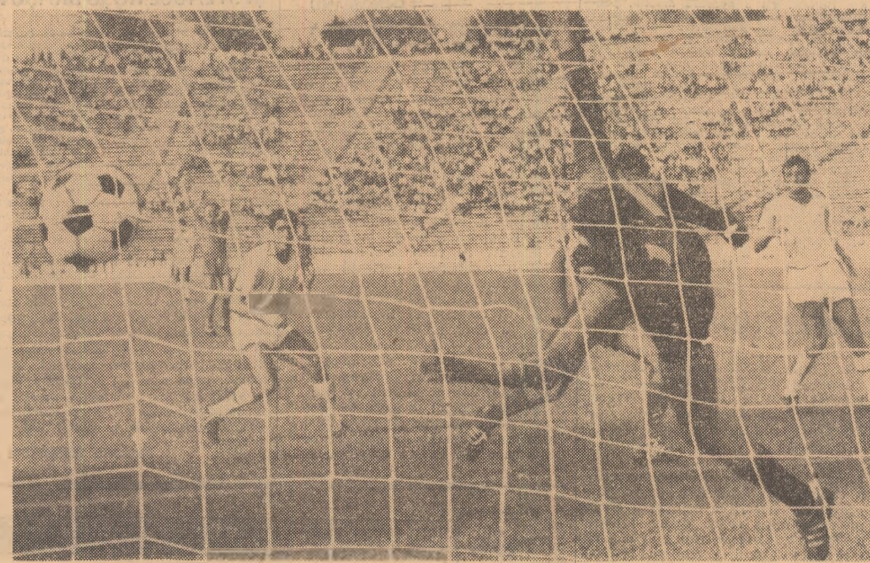
Năstase deschide scorul pentru Steaua

3 victorii ale oaspeților, 4 ale gazdelor