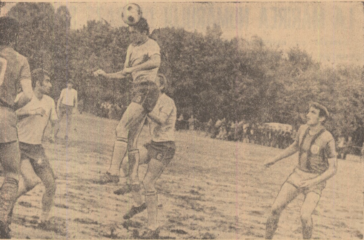
Facă de la antrenamentul de marș al lotului reprezentativ