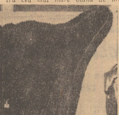
Trofeul de urs medaliat cu Marele Premiu

Este cunoscut faptul că asemenea medalii se acordă în raport cu punctajul pe care-l întruște fiecare trofeu punctaj stabilit prin formule internaționale, după masivitatea sau mărimea acestuia. Și iarăși, este cunoscut faptul că dimensiunile unui trofeu exprimă, implicit, mărimea și vigurozitatea animalului vînat. Așa se face că un trofeu medaliat cu aur exprimă și calitatea terenului care l-a produs, dar este în același timp și încununarea calităților vînatorești ale celui care l-a dobîndit. Sint ușor de imaginat dificultățile pe care le întîmpină un vîntor, pricteșă și singele roce de care trebuie să dea dovadă acesta pentru a reuși să împuște un urs sau un mistreț capat.