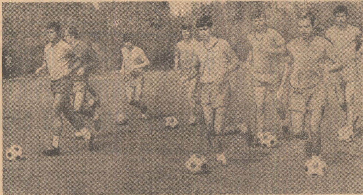
Fotoreporterul nostru Vasile Bageac vă prezintă echipa Steaua la ultimul antrenament dinaintea partidei cu F. C. Hibernians