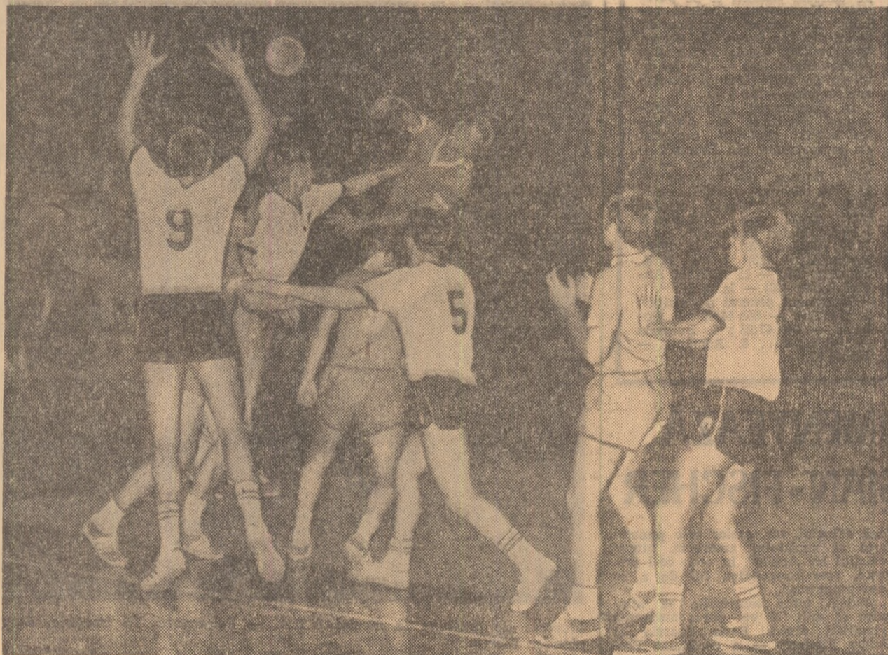
Fază din meciul Dinamo București - Universitatea Cluj, în care studenții s-au comportat bine, cedând la mare luptă în fața putericei formații dinamoviste.