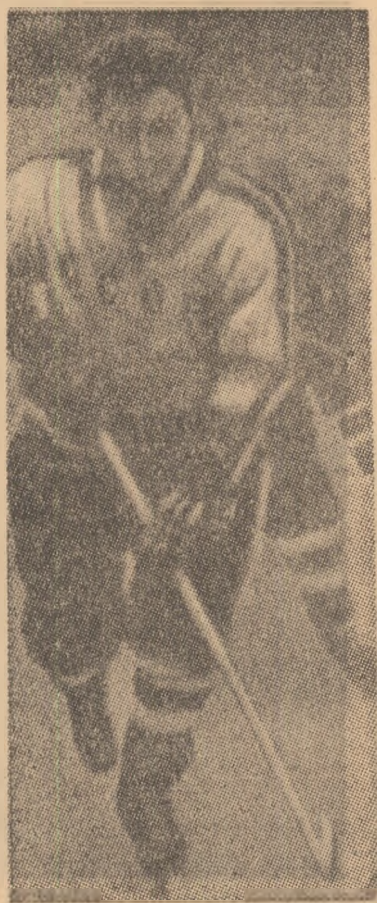
1938 la Moscova. Activitatea sportivă a început-o pe gheață, dar nu în hochei, ci în bandy, un sport asemănător hocheiului...