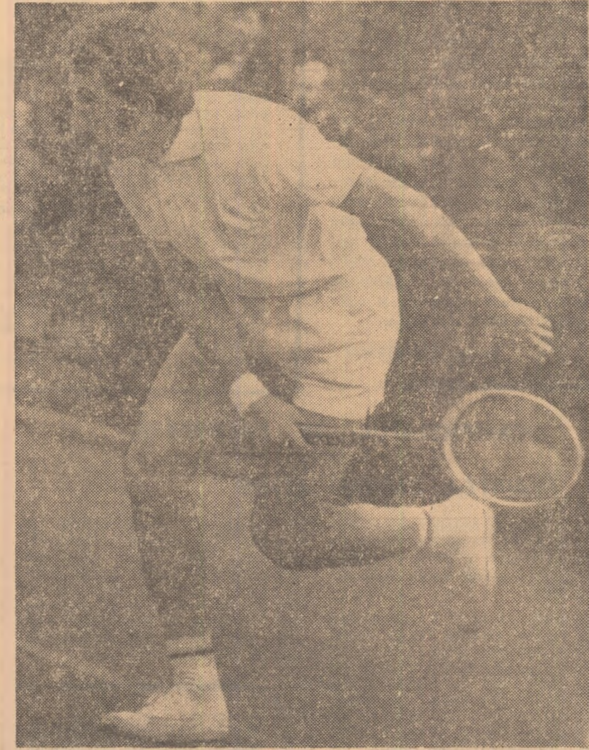
Ion Tiriac, omul care a decis calificarea României în finala Cupei Davis — prin victoria sa la Mandarino — este gata pentru ultimul asalt: Challenge-round