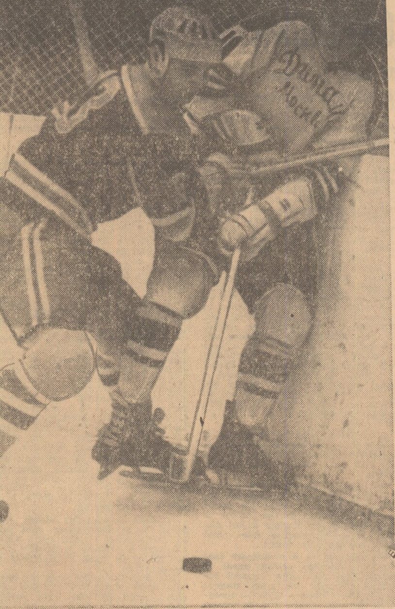
A început campionatul de hochei pe gheață al U.R.S.S. cu meciuri tii disputate în care jucătorii caută să se impună atenției antrenorilor celor trei loturi: pentru J.O., C.M. și Universiada. În fotografie cunoscutul atacant al lui Dinamo Moscova și al reprezentativei U.R.S.S., Maltsev

Pregătiri pentru Universiada de Iarnă, Jocurile Olimpice și campionatul mondial