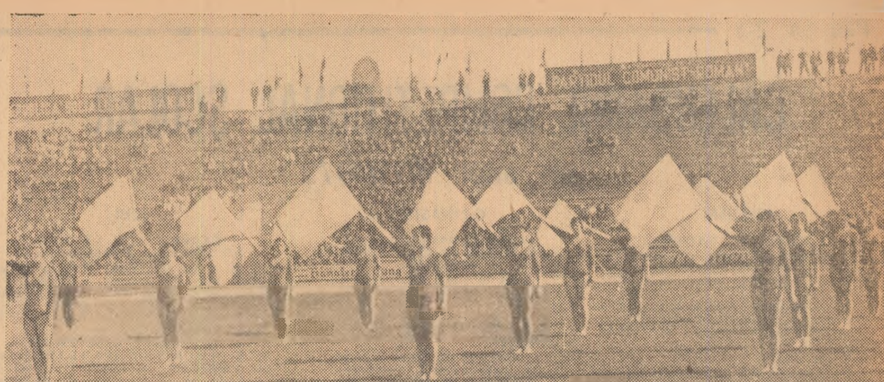
Aspect de la frumoasa demonstrație care a avut loc cu ocazia deschiderii anului sportiv școlar universitar la Timișoara.

ținutului pregătirii să fie însă mai îndrăzneasă în timpul curselor, mai bălăcoasă. Norma olimpică a realizat-o cu prietelul Balcanadei de la Zagreb când s-a clasat a treia cu 2:04,8. Romeo VILARA (Continuare în pag. 4-a)