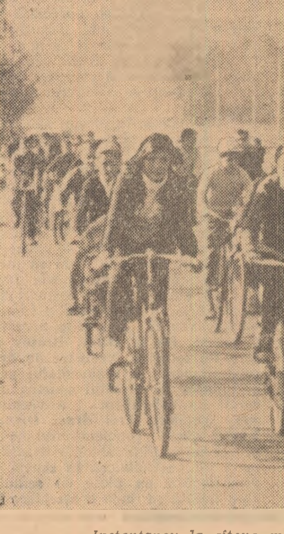
Instantaneu la cîteva minute după plecarea în excursia care a avut loc duminică trecută.

Duminică, ora 8,30, în fața Parcului sportiv Dinamo. Peste puțin timp urma să se dea plecarea într-o excursie spre lacul și pădurea Mogosoaia. Numeroși iubitori ai ciclismului, imbițați de zîmbetul unui prietenos soare de toamnă, așteptau cu nerăbdare să pedaleze pe traseul ales de Comisia municipală de specialitate a stadionului Dinamo — calea Floreasca — șos. Pipera — șos. Nordului — Băneasa — șos. București — Ploiești, varianta Buftea — Mogosoaia. Am înfîlțit, printre cei prezenți, pionieri și elevi de la Școala generală nr. 170, elevi de la liceul „N. Bălcescu”, studenți de la Institutul Politehnic, lucrători de la U.M.B., de la întreprinderile Metalurgică și Grafică Nouă, de la cooperativa „Ighiena”, de la Institutul de fizică atomică etc.