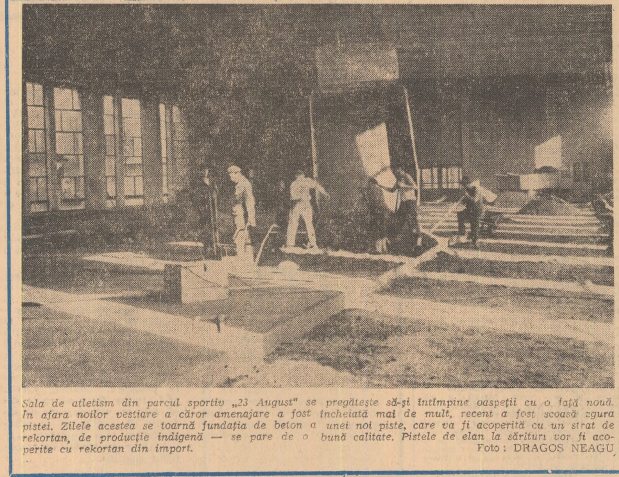
Sala de atletism din parcul sportiv „23 August” se pregătește să-și întâmpine oaspeții cu o față nouă. În afara noilor vestiare a căror amenajare a fost încheiată mai de mult, recent a fost scoasă zgrăvă pista. Zilele acestea se toarnă fundația de beton a unei noi piste, care va fi acoperită cu un strat de rekortan, de producție indigenă — se pare de o bună calitate. Pistele de elan la sărituri vor fi acoperite cu rekortan din import.