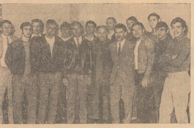
Fotbaliștii echipei „U” Cluj — fotografiați aseară în holul hotelului Munteni

Din motive binecunoscute, a șaptea noastră, duminică de fotbal începe astăzi, Dinamo — „U” Cluj și Universitatea Craiova — Rapid — semnează — de la ora 15,30 — uvertura etapei și fiecare partidă poartă în sine valențe de derby și multe puncte de atracție. Pentru că astăzi cele două dueluri ne interesează din punctul de vedere al clasamentului, dar și prin perspectiva cupelor europene, Dinamo și Rapid fac, deci, ultima repetiție înainte de jocurile cu Fejennoord (miercuri) și Legia (marți), și întâmplarea face ca partenerii de astăzi (nicidecum sparing-partenerii) să fie formații puternice, de ambiție și elan. Cel puțin meciul de la București, veritabil cap de afiș al etapei, poate fi numit fără rezerve „derby al calității”. „U” Cluj, reînscădat sub mîna antrenorului O. Simeș, a făcut impresie în acest început de campionat, forma sa (concretizată, printre altele, și de locuți bun din clasament) și laudele evoluțiilor din deplasare îndemnându-ne să credem că nu vom merge degeaba pe stadionul din soseaua Ștefan cel Mare. Adam, An-