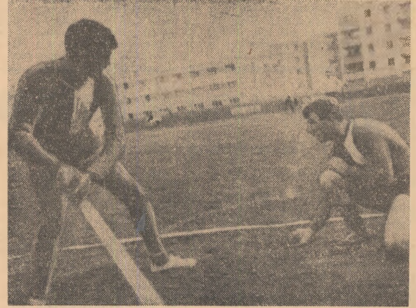
Mingea servită de coechipier jucătorului de la echipa Viața Nouă Olteni (jud. Teleorman) va poposi, poate, peste linia de fund a terenului, făcînd din meciul Viața Nouă — Biruința Gherdești (jud. Neamț)

Specialiști prezenti pe stadionul municipal din Botoșani, la ultimele întreceri ale campionatului național de oină pe anul 1971, au apreciat recenta finală pe țară drept cea mai echilibrată și mai valoroasă editie din cele 20 cîte s-au consumat pînă acum. În acest context, cucerirea de către echipa Combinatului poligrafic București a titlului de campion, pentru a 5-a oară consecutiv și a 8-a oară alternativ, sporește în importanță. Se poate afirma, deci, că medalie de campion se află în mîni bune, tipografic beneficiind, de-a lungul celor trei zile de concurs, de o pregătire fizică superioară și de o concepție tactică modernă de joc, datorită căreia au parcurs competiția neînvinși. Mulți dintre amatorii de oină se întreabă, poate, cum de reușesc bucureștenii să-și mențină supremația în