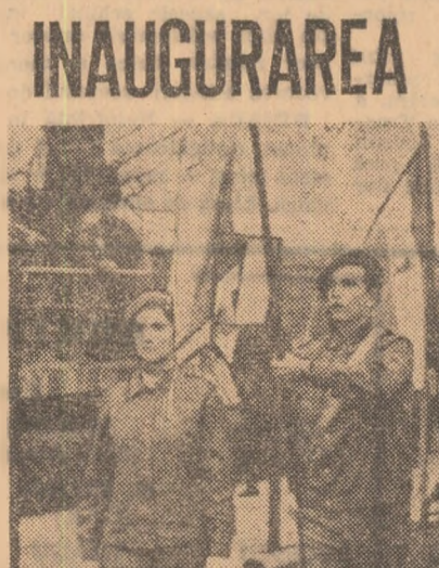
Defilează detașamentele de pregătire a tineretului pentru apărarea patriei