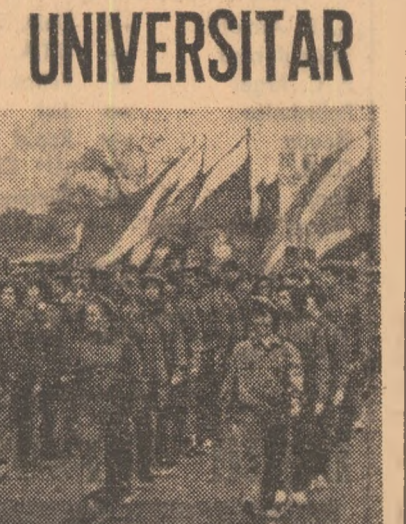
obținerea de către un număr din mare de studenți a însemnii de „șinț de țară”