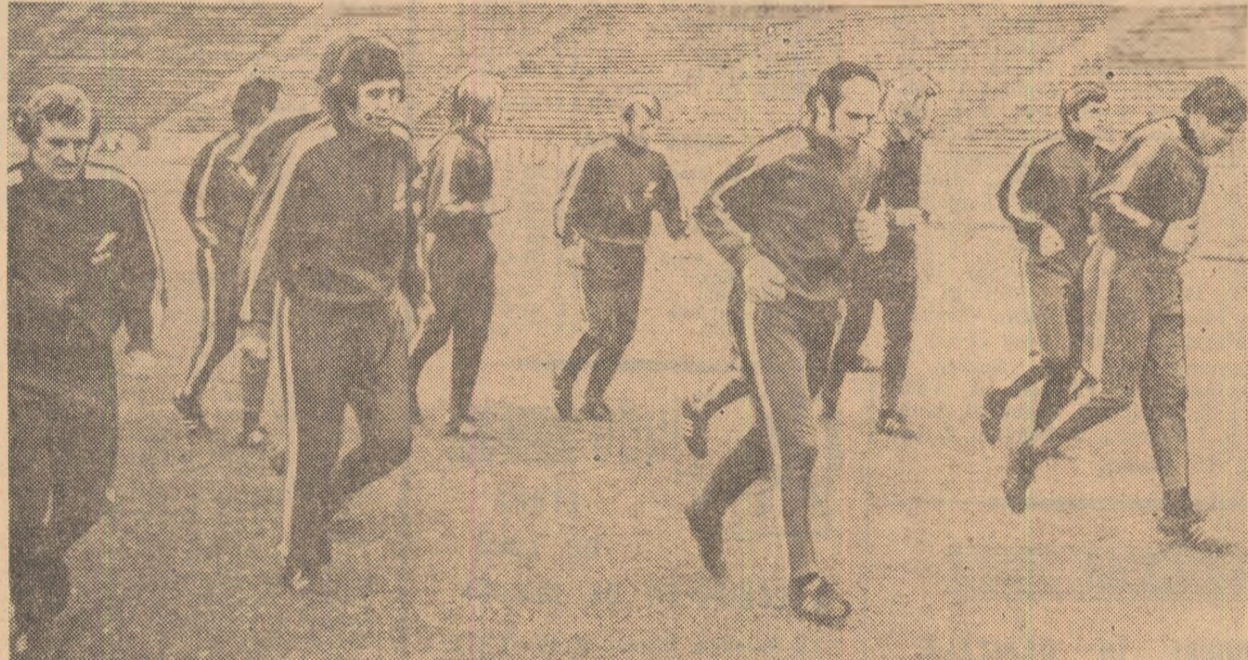
Fotbaliștii olandezi la antrenamentul efectuat ieri pe stadionul „23 August”, imediat după sosirea la București.