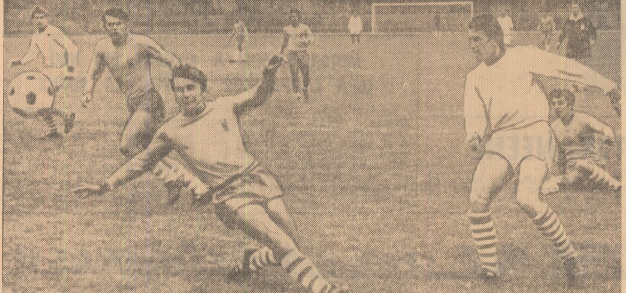
Din nou panică în careul oaspeților. (Fază din meciul Progresul București — Metalul Tîrgoviște)

nilor-surpriză pe care le crează. Prima repriză a fost evidențiată prin contraatacurile periculoase ale lui Atodresci, Puceș și Silaghi. În repriza a doua, Corvina a dominat, dar fără orizont, fiind din nou la un pas de a primi un gol în min. 60, la o frumoasă acțiune a lui Puceș. Scorul a fost stabilit în min. 43 de Silaghi, la o centrare a lui Rodnic. A arbitrat foarte bine O. Andresco (Satu Mare). Ei a anulat corect, pe baza ofsaidului care l-a precedat, autogolul lui Stan (min. 65). Radu TIMOFTE C.F.R. TIMISOARA — ELECTROPUTERE CRAIOVA 3-0 (1-0) Feroviarul a prestat un joc frumos, obținînd o victorie meritată. Punctele au fost realizate de Pa-