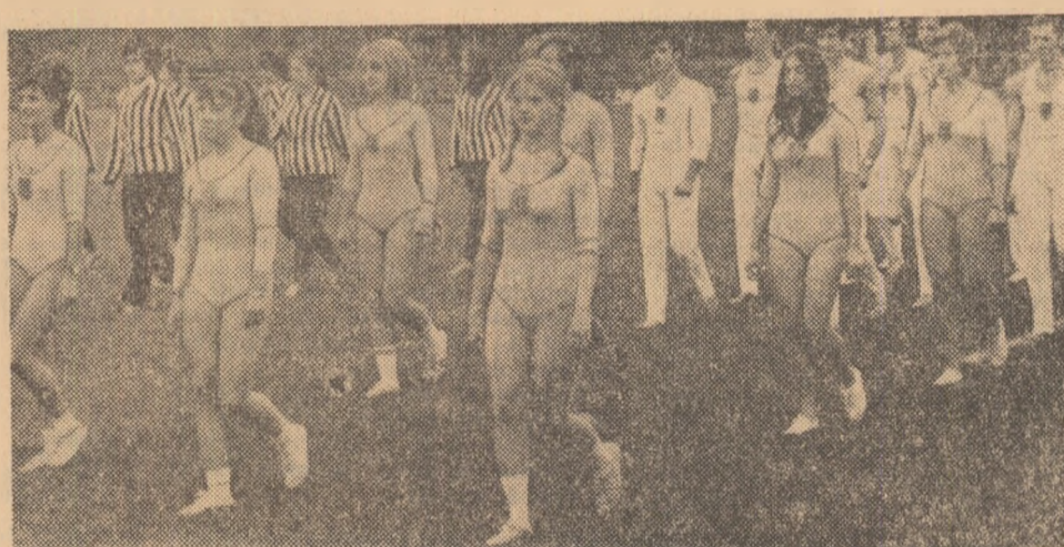
Gimnastele și gimnaștii de la I.E.F.S. au constituit o prezență remarcabilă la deschiderea anului sportiv universitar

Duminică au avut loc, în centrele universitare din țară, festivități prilejuate de deschiderea noului an sportiv și de pregătire a tineretului pentru apărarea patriei. La Timișoara, Tg. Mureș, Galați terenurile de sport au cunoscut din nou obișnuita animație stîrnită de competițiile studențești. Peste tot — după cum ne relatează corespondenții noștri — au avut loc demonstrații sportive, precum și întreceri prilejuate de tradiționala manifesta-re „Cupa anilor I”.