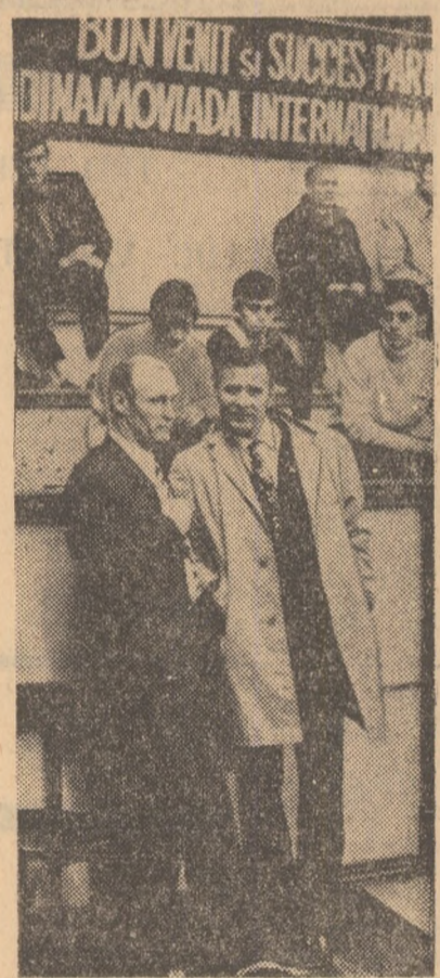
Lev Iașin la București! Într-adevăr, spre plăcută surprindere a spectatoriilor prezenți duminică după-amiază, la întrecerile Dinamoviștilor de baschet, celebrul portar sovietic, conducător tehnic al echipei de fotbal Dinamo Moscova, și-a făcut apariția în sală. Înconjurat de foștii săi coechipieri... Explicația acestei înalte prezențe este legată de scurta escapadă făcută la București de fotbalistii moscoviti, aflați în drum spre Turcia, unde vor juca miercuri, la Eskisehir, în „Cupa cupelor”.