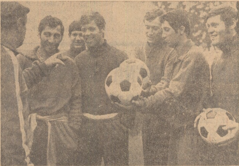
Moment de relaxare la sfîrșitul unui antrenament al dinamoviștilor. După meciul de astăzi le-am dori să fie la fel de zîmbitori.