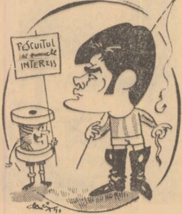
POVESTE CU PESCARU amatori... de puncte