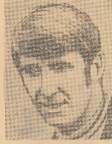
REES (Țara Galilor)

După cinci victorii consecutive, echipa finlandeză de fotbal Kokkola, care întreprinde un turneu în S.U.A., a fost învinsă cu 5-2 (2-1) de o selecționată a Ligii americane. Meciul s-a disputat la Union (New Jersey).