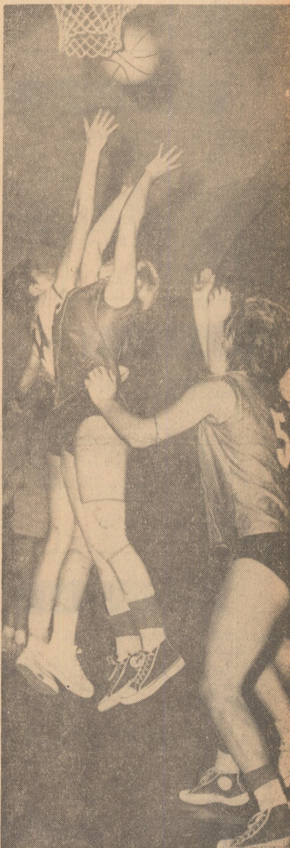
Sub panou, în luptă pentru mingea

Cît privește campionatul propriu-zis, vom remarca faptul că principalele pretendente la titlu se anunță, de astă dată, actuala campioană, Politehnica București, și I.E.F.S., dar că, pe parcurs, surprizele nu sînt excluse. Totul depinde de sirguința cu care se va pregăti fiecare formație, de dăruirea cu care vor fi abordate meciurile, de disciplina la antrenamente și în timpul jocurilor. Nu ne rămîne decît să urăm succes deplin celor mai bune echipe feminine de baschet ale României în prestigioasa lor întrecere!