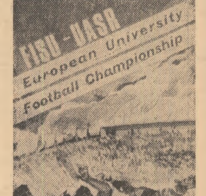
Interviu realizat de Paul OLEANU

Rezultatele individuale: BĂRBĂȚI: 100 m: T. Petrescu (CAU) 10,4; M. Georgescu (CAU) 10,6 (vînt din spate 2,8 m/s); 400 m: Gh. Petroniuș (CAU) 43,4; T. Puiu (Rapid) 48,7; 1500 m: Z. Gaspar (CAU) 3:58,5; I. Nicolae (CAU) 3:59,0; 110 m: H. Iliescu (R) 14,8; V. Teacă (CAU) 14,9; 3000 m: