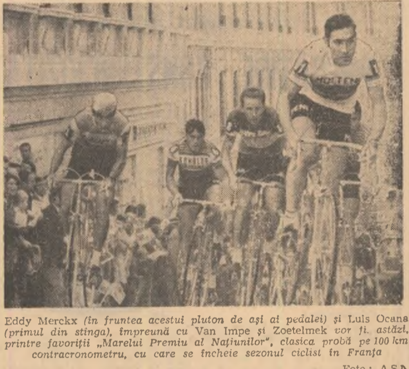
Eddy Merckx (în fruntea acestui pluton de ași ai pedalei) și Luis Ocana (primul din stînga), împreună cu Van Impe și Zoetemelck vor fi, astăzi, printre favoriții „Marelui Premiu al Națiunilor”, clasică probă pe 100 km contracronometru, cu care se încheie sezonul ciclist în Franța