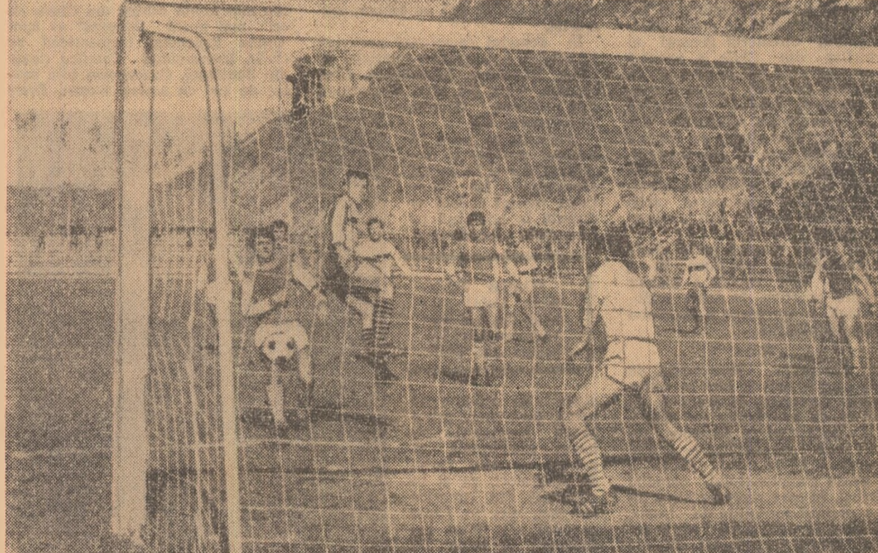
Fază din ultimul meci disputat pe stadionul din Valea Domaniului, cel dintre echipa locală C.S.M. și formația craioveană Electroputere, încheiat cu scorul de 1-0 în favoarea gazdelor.