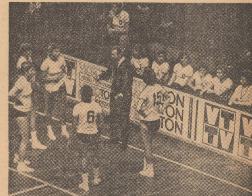
Time-out la Budapesta. „Dușorii fetelor”, sunt antrenorii jucătoarelor