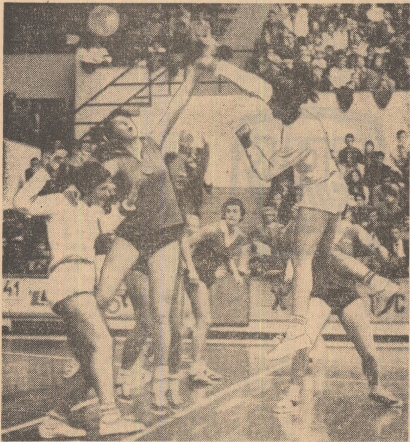
Doamna Bălcăoanu și-a confirmat — atunci când a tras cu curaj la poartă — forța de realizatoare în echipa noastră. În fotografie ea înscris un gol peste apărarea echipei U.R.S.S. și cu toată opoziția lui Vasilenko.