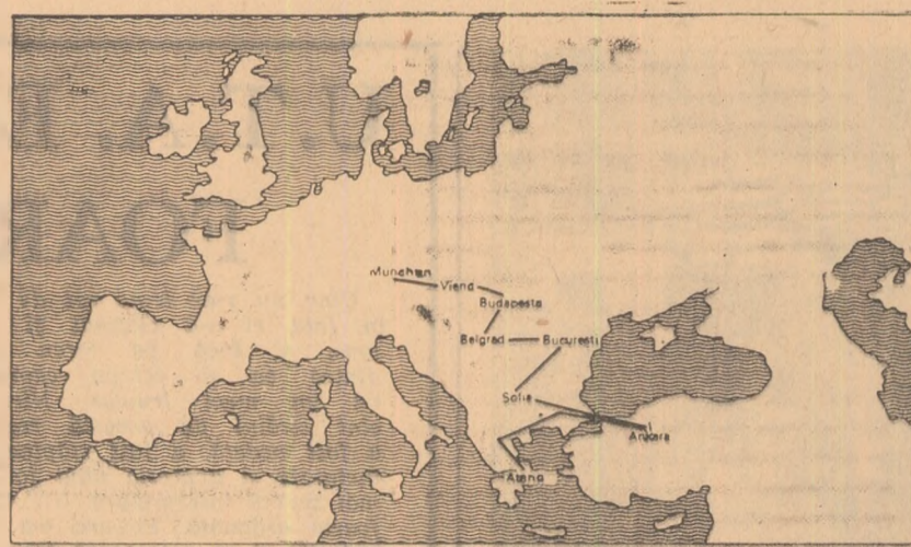
TRASEUL TORȚEI OLIMPICE