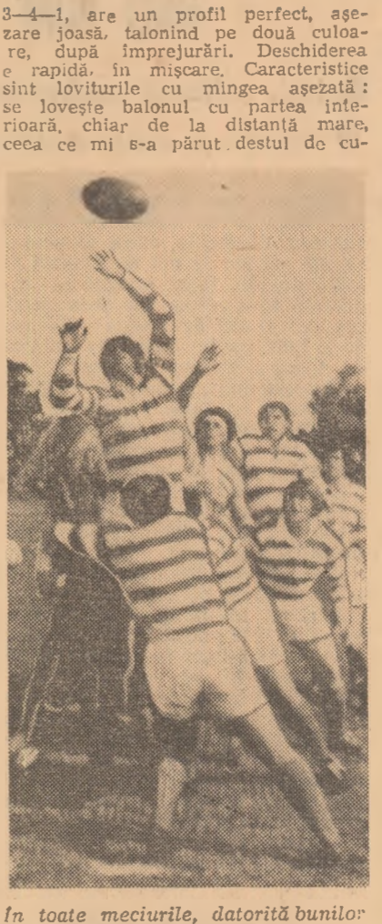
In toate meciurile, datorită bunilor și prințitorii, echipa Argentinei și-a asigurat baloanele la margine

Am avut prilejul să asist la cea de a 6-a ediție a Campionatului sud-american de rugby, organizat în capitala Uruguayului, între 7 și 19 octombrie, cu participarea următoarelor echipe: Argentina, Brazilia, Chile, Paraguay și Uruguay. De fapt, cu acest prilej, am descoperit rugby-ul sud-american cu totul necunoscut European, dese unei echipe ale vechiului continent (selecționata Francei Oxford-Cambridge etc.) au făcut vizite sporadice dincolo de Ocean. Dar, de atunci și pînă la acest campionat, rugby-ul a progresat mult în această parte a lumii.