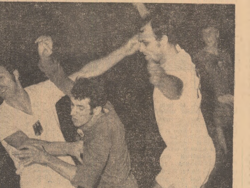
Încadrat de doi jucători vest-germani, Samungi reușește, totuși, să tragă la poartă și să înscrie. Fază din meciul România — R. F. a Germaniei.