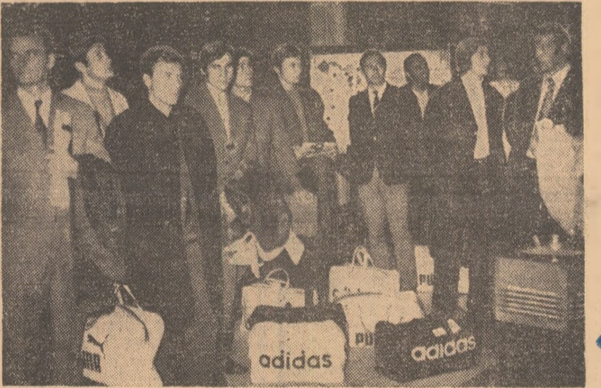
Lotul fotbalistilor cehoslovaci, la puține clipe de la sosire, în hotelul aeroportului internațional Otopeni.