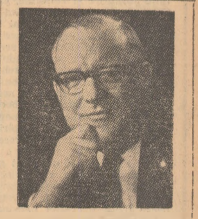
PREȘEDINTELE U. E. F. A. LA BUCUREȘTI