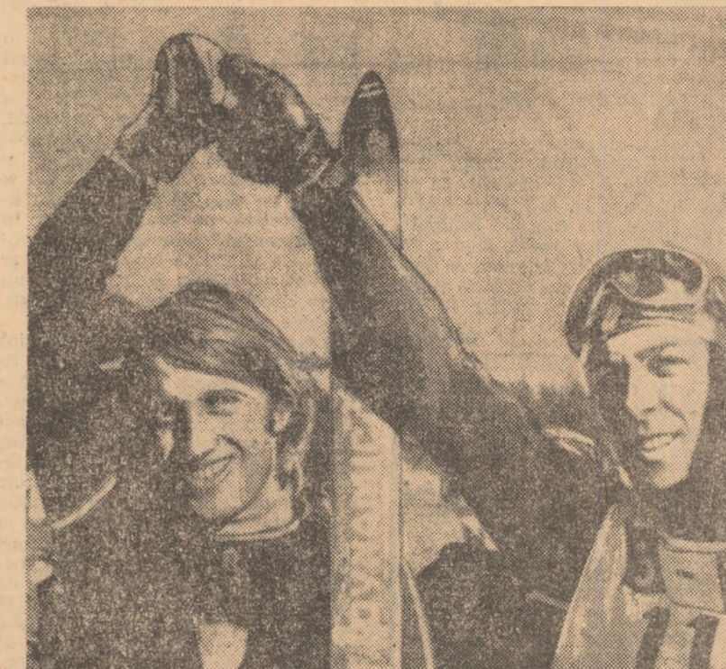
Gustavo Thoeni (dreapta) și J. N. Augert, vedetele anului trecut vor fi și în acest sezon printre fruntași.

vor fi desemnați concurentul sau concurența cu cel mai mare punctaj în toate cele 3 discipline. În caz de egalitate la punctaj, va conta numărul cel mai mare de locuri 1, 2, sau 3 obținute. Pe lângă desemnarea și atribuirea titlului de cam-