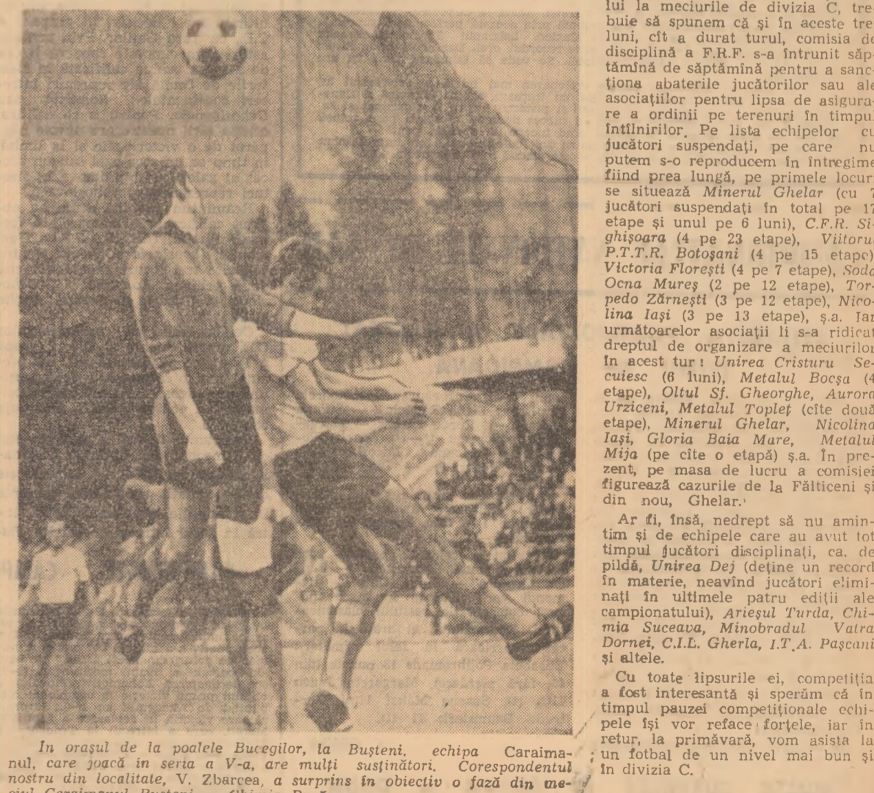
În orașul de la poalele Bucegilor, la Bușteni, echipa Caraimanului, care joacă în seria A-V, are mulți susținători. Corespondentul nostru din localitate, V. Zbarcea, a surprins în obiectiv o fază din meciul Caraimanul Bușteni — Chimia Buzău.

Jocul practicat în „C” continuă în să fie — în general — nesatisfăcător, partidele sînt — cu mici excepții — de o modestie tehnică supărătoare. Aproape toate asociațiile sportive nesocotesc indicația federației de a promova cît mai mulți tineri cu perspectivă, care să-i înlocuiască pe așa-zisii oameni de bază, veterani care sînt plafonați din punct de vedere tehnic sau terminat — vîrstă. Ei mai strălucesc în cîte un meci dar la strictețe teceleste. Inseși ieșirile nesportive, care din păcate abundă încă în jocurile de „C”, se datoresc, de obicei, acestor jucători vîrstnici, care suplinesc lipsa tehnicii și a condiției fizice cu durități din, totodată, și un prost exemplu fotbalistic din tîna generație.