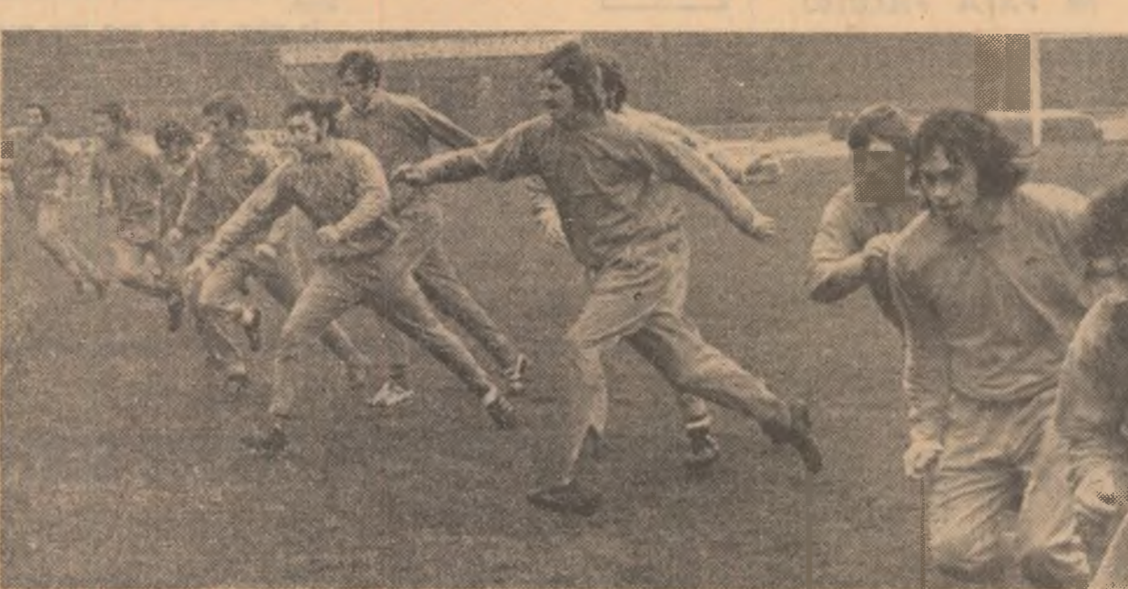
Iată-i pe jucătorii galezi în plin exercițiu la antrenamentul de ieri. Alergare ușoară cu rupei de ritm și schimbarea direcției.