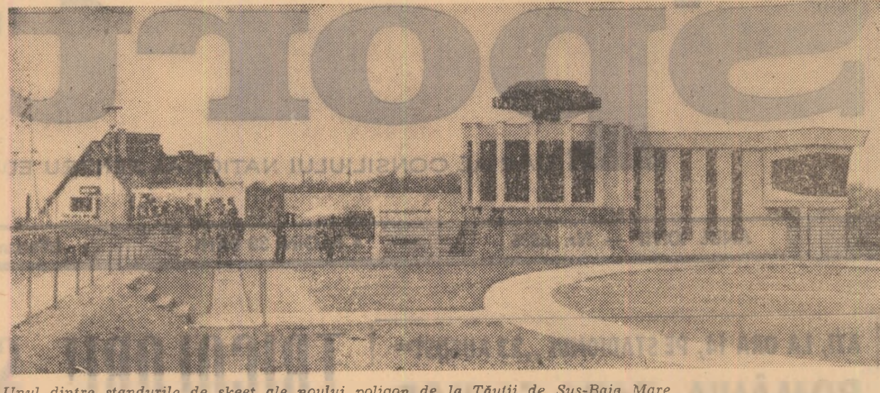
Unul dintre standurile de skeet ale noului poligon de la Tăuții de Sus-Baia Mare